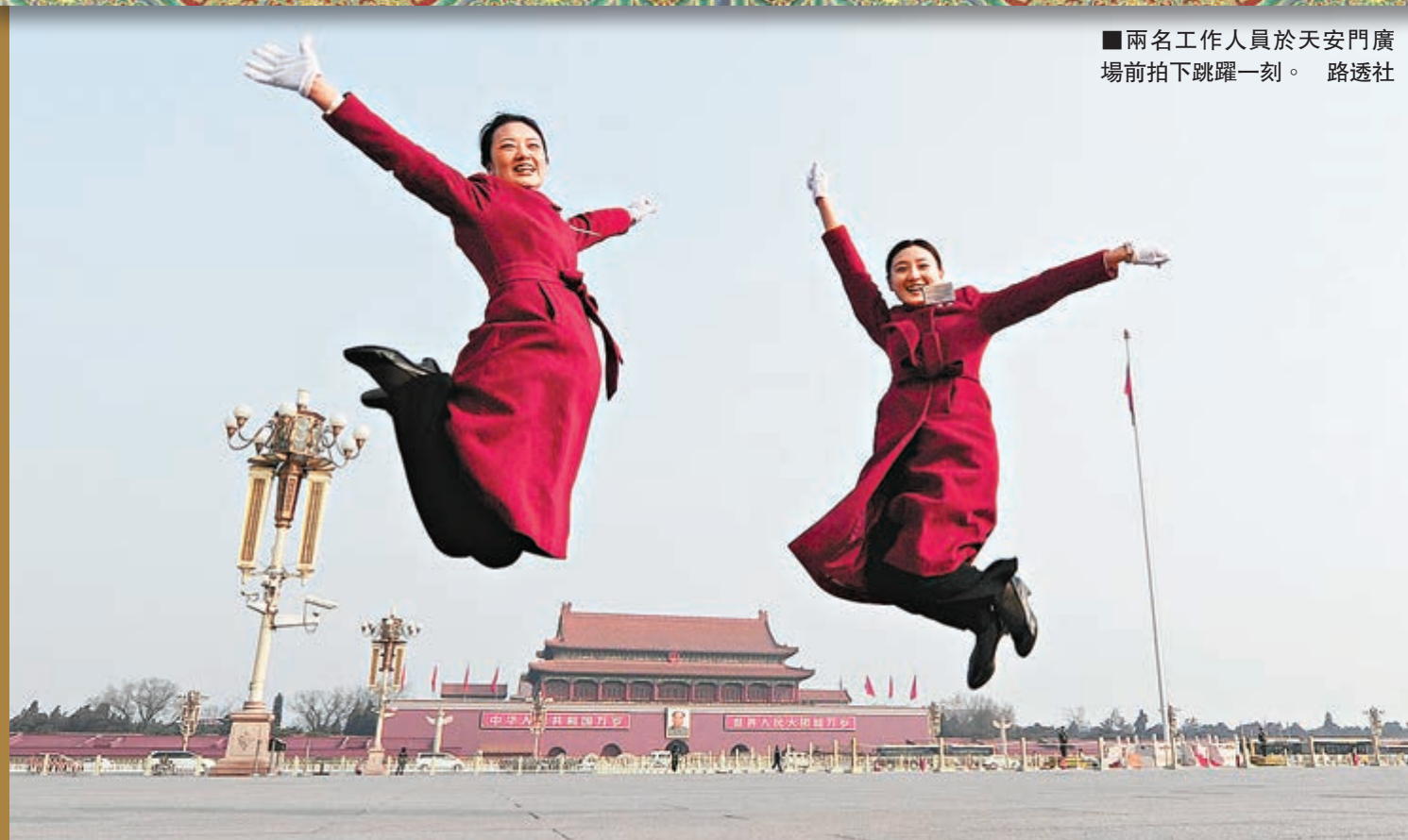
兩名工作人員於天安門廣場前拍下跳躍一刻。