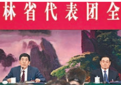
王儒林（右）與全國人大代表、吉林省省長巴音朝魯（左）。

香港文匯報訊（兩會報道組 于珈琳）在昨日舉行的十二屆人大二次會議吉林代表團審議會議上，全國人大代表、吉林省委書記王儒林強調，吉林是我國重要的商品糧基地，去年的糧食產量達到710.2億斤，位列全國第四，糧食商品率逾80%。農村土地改革重要又複雜，吉林省正在申請試點農地土地所有權、承包權和經營權的「三權分離」，探索農村土地改革的新路徑。