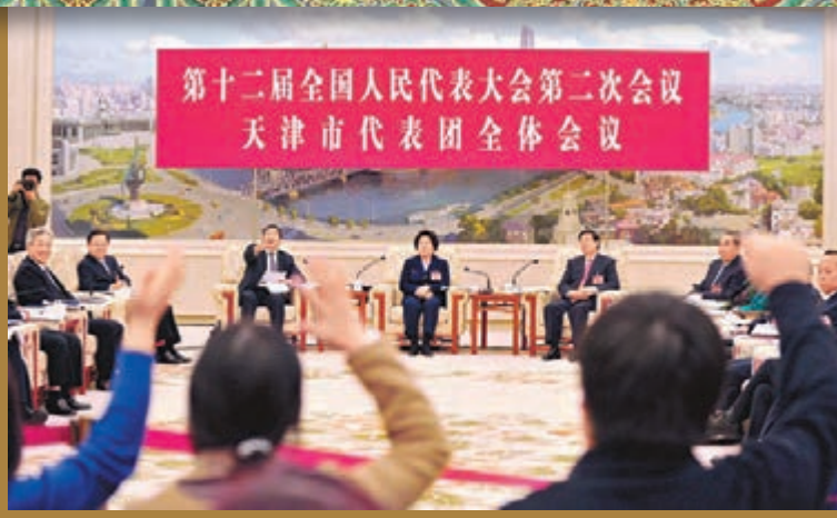
天津代表團全體會議現場。後排中為孫春蘭。