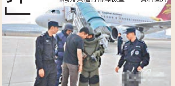
虛假信息危害飛行安全，圖為當局排員進行排爆檢查。

同時，司法部門也應當出台相關解釋，對損失的金額計算標準予以明確，減輕被侵權人的舉證責任，便於追究侵權行為人的民事責任。