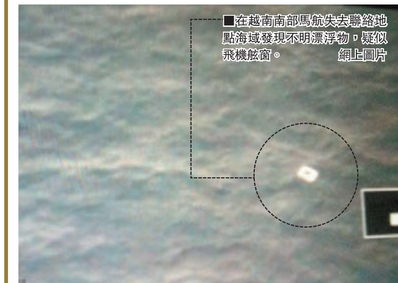
在越南南部馬航失聯聯絡地點海域發現不明漂浮物，疑似飛機舷窗。