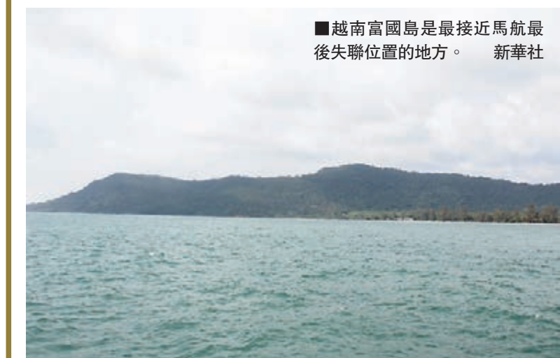
越南富國島是最接近馬航最後失聯位置的地方。