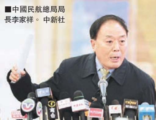
中國民航總局局長李家祥。

李家祥表示，中國政府已經啟動了包括民航、外交、海上救撈等綜合措施在內的救援手段。中國海軍也已經出動。此外，中國已經聯繫到相關