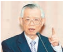
彭淮南稱貨幣貶值應該是買點。

這些「台灣大媽」又愛又怕受傷害，想逢低承接，又怕蒙受損失；但經過專一番分析後，投資人已經恢復信心，掌握貶值就是買點的訣竅，分批承接人民幣。銀行主管說，長線而言人民幣仍具升值潛力，漲多回檔修正在所難免，民眾若擔心風險，可逢低分批承接、降低風險。