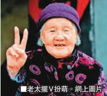
老太擺V扮萌。網上圖片

講孫氏是山東臨邑人，15歲就出嫁，今年已100歲(虛歲)。老人年輕時特別勤快，雖然是小腳，但地裡的農活樣樣拿得起、放得下。為了貼補家用，老人還紡線、織布、染布。為了趕集賣布，老人常常要用小腳走十幾里路。老人還有一個本事，就是說媒。她走這家，串那家，看着兩人差不多，就說和。孩子們說，老人說媒的成功率比現在的電視相親成功率還高。最老太還是個趕時髦的人，經常玩玩孫子家的