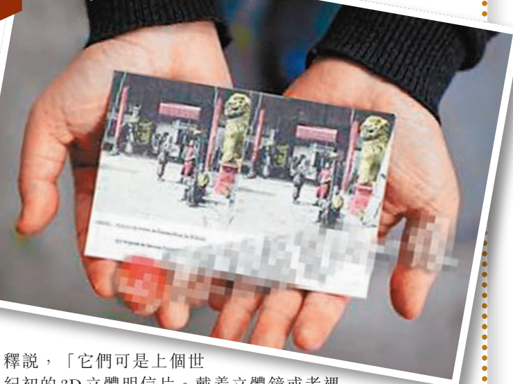
百年前的3D明信片。

釋說，「它們可是上世紀初的3D立體明信片。戴着立體鏡或者裸眼用正確方法觀看這些照片，就能看到兩張照片合成一張的立體效果。」攝影專家介紹，早期立體照相技術，是利用人們兩眼的視差，用傳統照相機來拍攝一組照片，然後使用立體鏡來重現立體影像。要拍成一張立體照片，必須拍攝兩張具有視角差效果的照片。對於靜態景物拍攝，只要用一部相機，先在某一位置拍一張照片，然後平行移動照相機幾厘米，再拍攝一張，就得到了一組具有視差的照片。