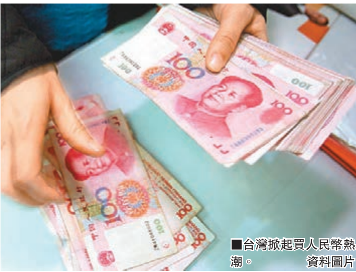
台灣掀起買人民幣熱潮。資料圖片

「央行」上月公布，1月底DBU人民幣存款餘額為1,658.19億元，近期幾家大型行庫存款迅速累積，不到1個月人民幣存款就增加數十億元，2月底的人民幣存款餘額，很有機會挑戰人民幣2,000億元大關。銀行主管說，前些日子，眼見人民幣兌美元匯率急轉直下，急壞一票投資人，紛紛打電話到銀行探詢是否被套牢，或查詢是否適合加碼人民幣，還是應該解約減輕匯損。