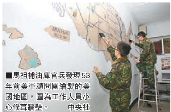
馬祖補油庫官兵發現53年前美軍顧問團繪製的美國地圖，圖為工作人員小心修繕牆壁。

台灣有關方面稱，油庫單位的營區，過去是美軍顧問團招待所，營舍內還可以看到美國家庭常見的壁爐及煙囪，戶外步道旁雕塑有龍鳳石像與石獅。這些遺跡雖稱是美軍顧問團軍方所遺，但軍方不具名人士認為，美國國安局五十餘年前曾以「西方企業公司」名義進駐馬祖，這些設施、壁畫應該是為西方公司進駐人員所興建繪製。