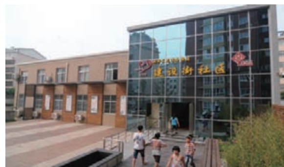
■新華區建設街社區。