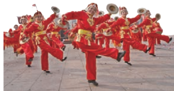
■豐富多彩的社區文化生活。