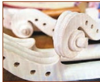
■剛剛打磨好的琴頭和琴身。