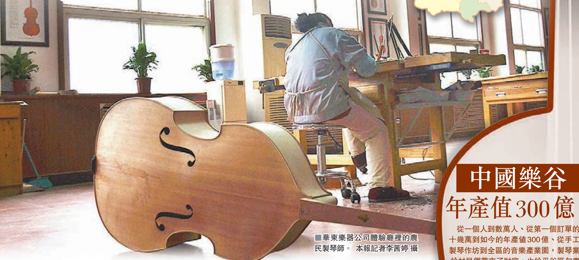
■華東樂器公司體驗廳裡的農民製琴師。