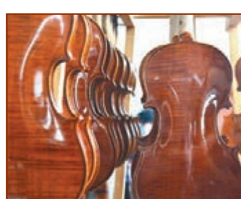
■華東樂器公司體驗廳裡掛着剛剛上好漆的小提琴。