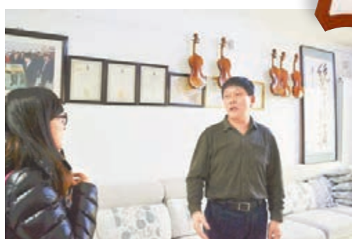
■本報記者在常中秋家採訪，牆上掛着他獲得的各項榮譽及得意的小提琴。