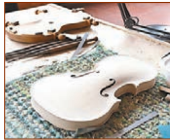
■小提琴正面一般採用質地偏軟的松木，而背面一般採用質地偏硬的楓木。