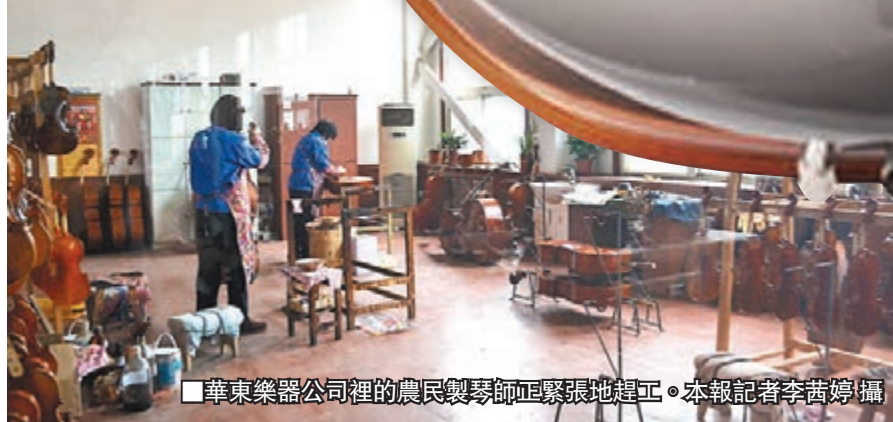
■華東樂器公司裡的農民製琴師正緊張地趕工。