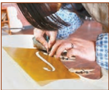
■農民製琴師製作琴身的正面。