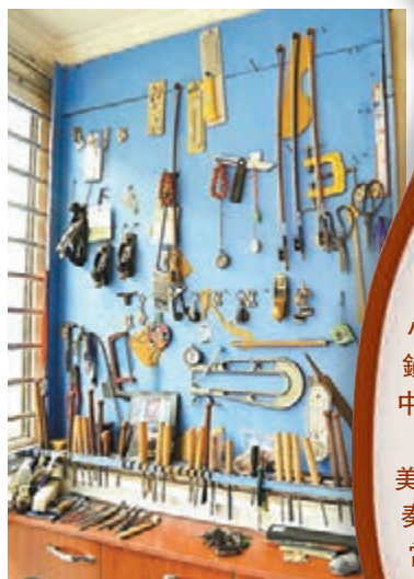
■常中秋迷你工作室的牆上掛着各式各樣的製琴工具。