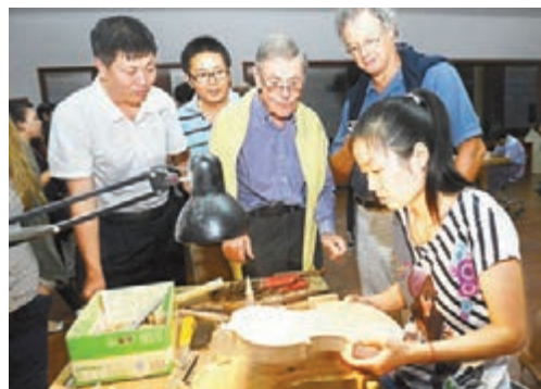
■法國元老級琴弓製作家貝那特-米朗等在華東樂器有限公司觀看工人們製作小提琴。

14位西班牙音樂家用小提琴、中提琴、大提琴、低音貝司奏出曼妙之音，他們選擇的聽眾是這些樂器的生產者——東高村鎮800名農民製琴師。2007年，常年使用東高村鎮提琴的西班牙樂團專程來到平谷，為農民製琴師演奏一場特殊的音樂會，他們用自己的手藝，征服了來自世界的音樂家！這些農民在華東樂器公司的培訓下成為專業製琴師，一些技術精湛的製琴師已成為業界佼佼者。