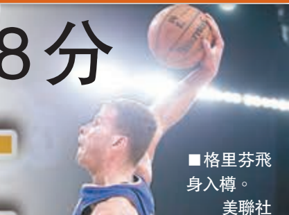
■格里芬飛身入樽。

今場賽事戰況呈現一面倒，戰至半場，快艇已經以73:40領先，而在第3節後，有不少主場球迷紛紛離座，不欲再觀看支持的球隊被宿敵蹂躪，結果湖人於今場以94:142大敗，打破1995年時以83:129不敵拓荒者的舊紀錄，寫下球隊史上最大敗仗。