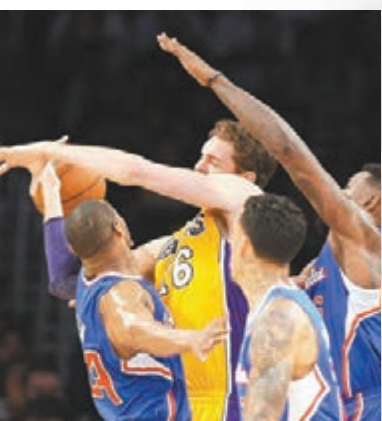
■加素(黃衣)遭3名快艇球員重重圍困。 「我從小生長在東海岸，而且我曾經發誓不會離自己的家鄉太遠，但這裡(洛杉磯)每天明媚的陽光讓我流連忘返，在來到這裡2年半後，我發現我已經愛上這座城市。」

另外，據報在剛結束的第9屆洛杉磯體育大獎頒獎典禮上，快艇後衛基斯保羅成功力壓其他明星，當選洛杉磯當地的年度最佳運動員。在頒獎禮上，CP3謙遜地表示，自己已經愛上洛杉磯這座城市，很榮幸能在這裡打球：