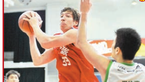
■南華昨晚在修頓室內體育館舉行的男子高級組銀牌籃球揭幕戰中，以90:58大勝惠龍兒(左)攻入全場最高的29分。