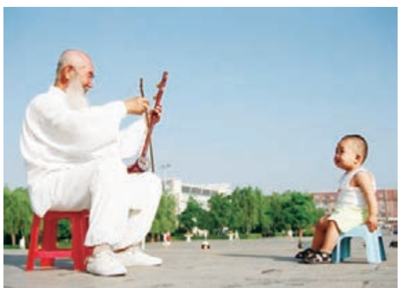
■爺孫樂——瀋河區着力打造生態人居新區。

一句「輕輕地」打動了人們內心最柔軟的部分，讓人為之感動。「輕輕地」體現了一個城市管理者對生態、對自然的尊重；「輕輕地」體現了一個城市管理者對良性經濟發展規律的領悟；「輕輕地」體現了一個公僕對民眾的情懷。我們有理由相信，能夠將「城市輕輕地放在山水之間」的城市管理者必然能夠妥善解決生態環境與經濟發展之間所有的矛盾關係。