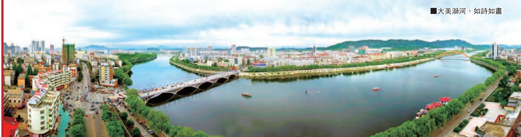
■大美瀋河，如詩如畫。

以「大美瀋河·美麗鄉村」作為大美瀋河建設的「第三大平台」，是瀋河區強力推進新型城鎮化建設的扛鼎之作。正如習近平總書記所指出的：「讓城市融入大自然，讓居民望得見山、看得見水、記得住鄉愁。」開展大美瀋河·美麗鄉村建設，是瀋河區委、區政府落實上級新型城鎮化建設的實際行動，是應對鄉村復建浪潮的治本之策，也是打響「中國最美茶鄉」品牌的迫切需要。瀋河區有着得天獨厚的生態優勢，這裡山清水秀、人傑地靈、物華天寶；這裡有地球上最高緯度、最大規模的成片茶園，環湖86公里茶文化長廊在國內絕無僅有，森林覆蓋率高出全國43個百分點，是全國44個極紐城市之一。瀋河區堅持把區內1512平方公里的土地作為「一座沒有圍牆的生態博物館」來規劃，把「每一個鄉村都作為一個景區」、「每一戶民居都作為一個景點」來改造，精心打造了環湖86公里「中國最美茶鄉精品觀光帶」、以沿107國道鄉鎮為依托的「豫南楚韻精品觀光帶」、以沿淮鄉鎮為依托的「高效農業精品觀光帶」等三條精品觀光帶，把大美瀋河構成一個「美的共同體」。