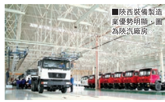
■陝西裝備製造業優勢明顯，圖為陝汽廠房。

比亞迪已成為新能源汽車的「領頭羊」，法士特重型汽車變速器產銷量連續七年穩居世界第一。陝西省還具備發展汽車工業較強的科教實力，以及良好的裝備製造業基礎。