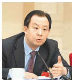
黑龍江省省長陸昊回答記者提問。

香港文匯報訊（兩會報道組 于珈琳）去年夏天，黑龍江流域和俄羅斯遠東地區遭遇30年一遇洪災，當時俄媒體指責遠東地區洪水肆虐是中國洩洪帶來的威脅。對此，黑龍江省長陸昊表示，「在我的水文概念裡，俄羅斯對去年的這場洪水『貢獻』更大。」就此，他提出黑龍江或阿穆爾河的水利水文合作勢在必行，否則雙方都會遇到挑戰。