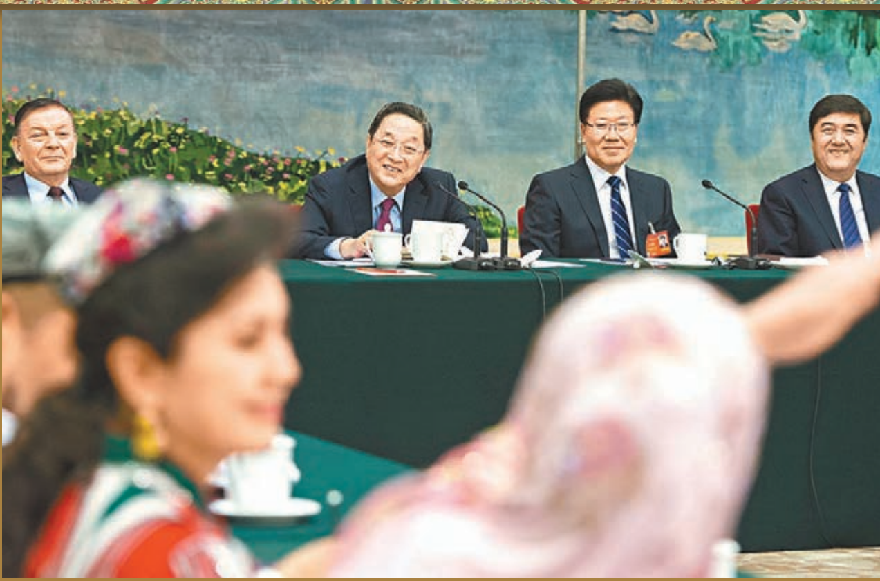
俞正聲參加新疆人大代表團的審議。

香港文匯報訊 國務院總理李克強昨日下午在參與雲南人大代表團審議時，關切詢問昆明「3·01」暴力恐怖事件傷員救治等情況，對在打擊暴恐中作出貢獻的公安幹警、武警戰士、醫護人員表示慰問和感謝，要求繼續做好傷員救治。李克強強調，「要堅決打擊暴力恐怖犯罪，讓人民群眾有安全感、安寧感！」此外，全國政協主席俞正聲同日在參與新疆人大代表團審議時指出，暴力恐怖分子是各族人民共同敵人，要堅決依法打擊暴力恐怖犯罪，全力維護社會大局穩定。