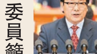
吳江在全國政協全體會議上發言。

此外，對於混合所有制改革，全國人大代表、四川川威集團董事長王勁昨日亦向本報表示，混合所有制改革總體而言是利好，但在改革過程中切記不要限定必須是國有控股，在他看來，國有可以控股，也可以不控股，不要刻意設置條框，影響企業靈活性。