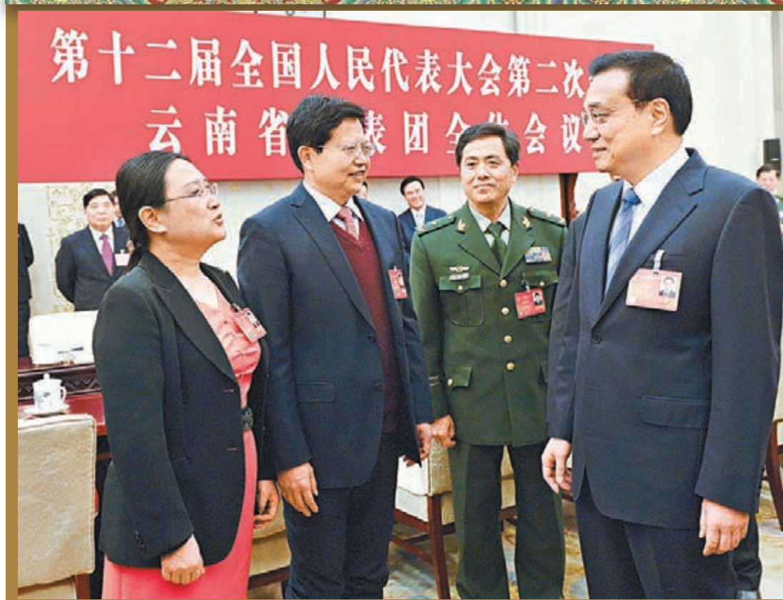
李克強對在打擊暴恐中作出貢獻的公安幹警、武警戰士、醫護人員表示慰問和感謝。