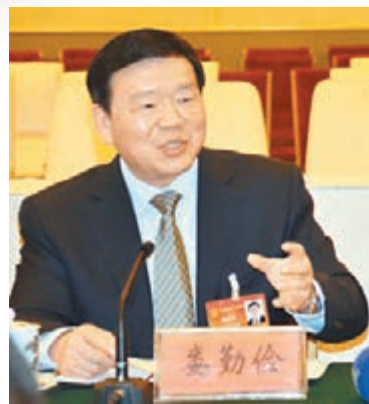
陝西省省長婁勤儉認為陝港可在金融、物流等領域合作。

香港文匯報訊（兩會報道組 李陽波）陝西人大代表團昨日上午舉行媒體開放日。陝西省省長婁勤儉在接受媒體採訪時表示，香港的一大優勢就是金融，未來香港要拓展，其金融中心可能還得走出來，如果把西安打造成香港的金融中心，將有利於香港進一步拓展市場。陝港在金融領域合作最有前景，雙方應加強合作，共同發展。