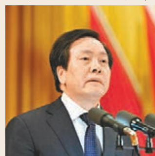
河北省委書記周本順。