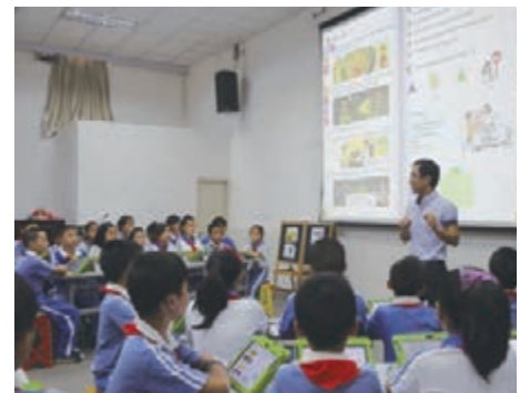
■龍崗區鳳凰山小學「智慧校園」英語課堂。

年實施首期項目，規模涉及11所學校44個班級2200名學生。2013年6月13日《新聞聯播》對龍崗鳳凰山小學的電子書包項目進行了報道。「數字教育」的紮實推進建設，以現代化的教學工具、教學手段來推進教育理念、內容的實質性變革，進一步促進了教育公平化、均衡化發展。 同時，龍崗教育局致力「三通」平台項目建設，首期投資451萬元，選定區實驗學校等6所學校共建設精品錄播教室6間、普通錄播教室30間。龍崗中心小學等6所學校被確定為深圳市首批「智慧校園」示範學校創建單位；龍城小學等14所學校評為教育信息化特色學校。積極創作微電影作品，龍城高級中學《破譯教育密碼 探秘龍城高中》、盛平小學《紅燈》等微電影作品榮獲全國校園電視作品大賽「金鑽獎」，傳播了教育正能量，得到廣泛好評。