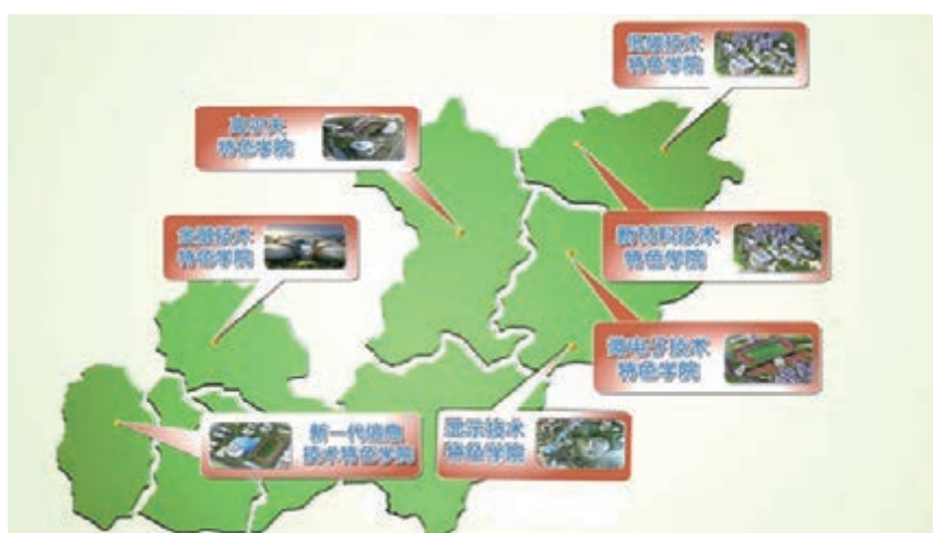
■特色學院佈局規劃圖。