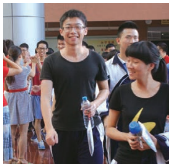
■陽光自信的龍崗學子走向考場。

龍崗是教師精英的搖籃，2萬教師為和諧教育建設奉獻青春和力量。5年來，面向全國和重點高校引進優秀教師、優秀畢業生4196人。同時，重視教師在職崗位培養和專業成長，661人成長為特級教師、全國優秀教師、省市區級名校長名教師、骨幹教師及教壇新秀。 龍崗教育系統堅持「凡進必考」，大量引進優秀人才，以增量改善存量。2012年招收全國重點師範院校優秀本科生、研究