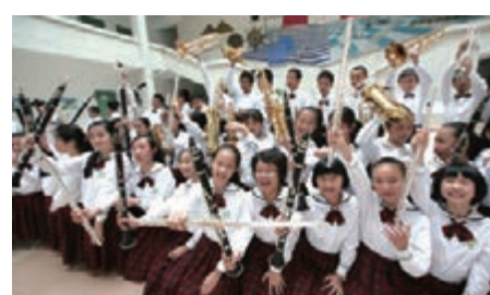
■全國藝術展演中屢次獲金獎的龍崗區實驗學校管樂團。