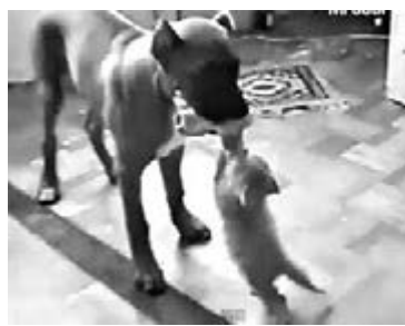
貓咪又撕又拉大狗口中的肉塊。 網上圖片