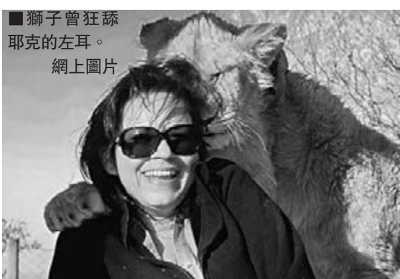
獅子曾狂舔耶克的左耳。