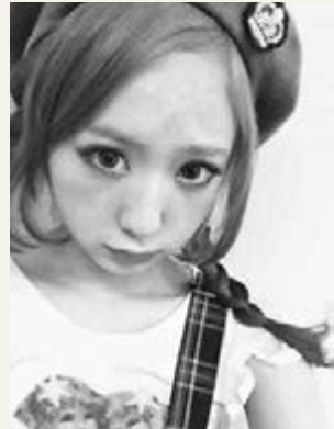
日本一名模特兒看來像生病。

日本偶像組合成員白石麻衣是少女公認的標準病弱顏美女，還成為她們的模仿對象。不少日本網站及雜誌亦紛紛教人如何化出病弱妝。