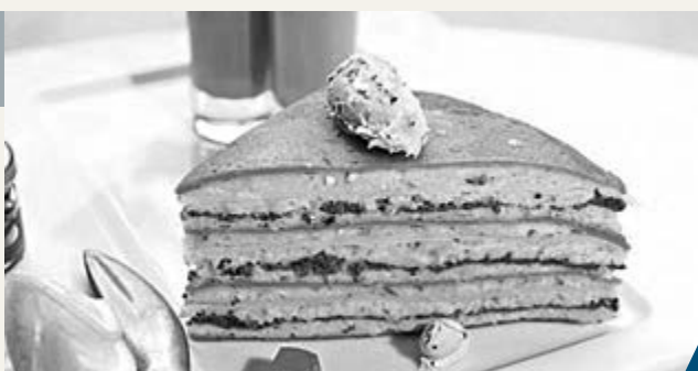
班戟以魚子醬、黑松露等貴價食材製成。

大廚唐斯表示，班戟不會列在菜單，若有顧客想一嚐風味，可即叫即製。2009年Opus推出當時全球最貴的金箔班戟，每個售144英鎊(約1,866港元)。