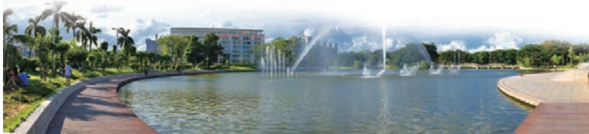
■石排城市廣場音樂噴泉匯聚八方人氣、活躍商貿氛圍。

收總額接近翻番，新引進的6宗重大項目將在今明兩年全部建成投產；在城市發展上，建成了17項對環境和形象有明顯提升作用的重點城建工程。「如今的石排，厚積薄發，發展拐點已經到來。」2014年，石排鎮加快提速增效，力爭順利突破經濟發展拐點。堅持產業立鎮，切實提升經濟綜合實力。力爭重大項目招引有新成果，民營辦、外經辦、經貿辦三個部門要繼續各引進至少一個投資總額6億元以上的重大產業項目。打好重大項目落地攻堅戰，確保安博物流一期、康師傅、銘普三個重大項目今年如期投產；全力以赴推動安博物流二期、普洛斯、氣派科技、寶強等四個重大項目和星星光電項目如期建設。對重點項目工作不落實、推進不到位的部門和個人追究責任。陳志明滿懷信心，「未來兩三年，只要方向不變，步伐不停，石排就一定能夠實現質的改變。奮力推動一城兩區三湖四大板塊建設，全力突破發展拐點，譜寫建設美麗的紅石古鎮的新篇章！」