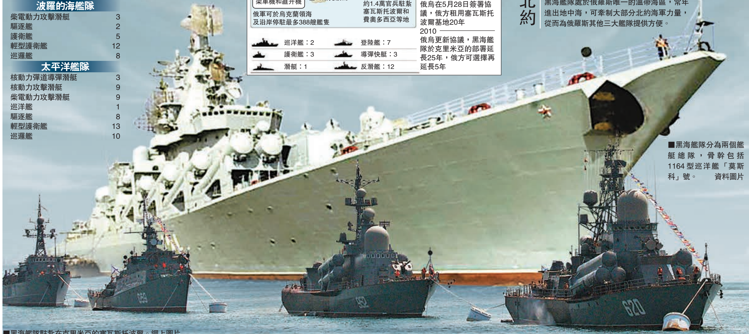
黑海艦隊分為兩個艦艇總隊，骨幹包括1164型巡洋艦「莫斯科」號。資料圖片