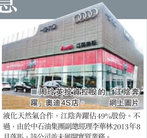
周玲英投資控股的「江陰奔躍」奧迪4S店。

液化天然氣合作，江陰奔躍佔49%股份。不過，由於中石油集團副總經理李華林2013年8月落馬，該公司並未展開實質業務。