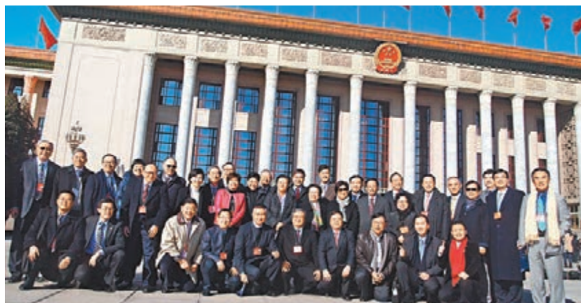
■港區人代在人民大會堂前大合照。