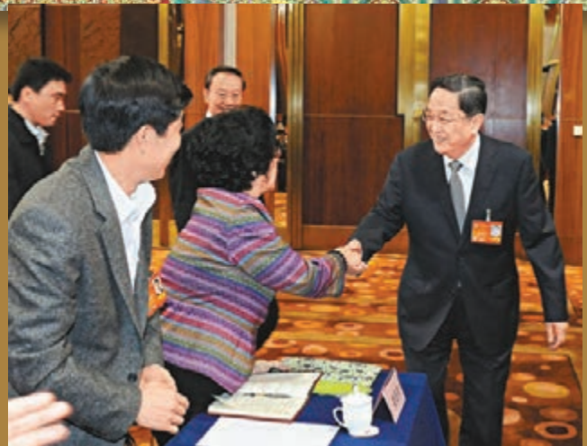
■全國政協十二屆二次會議教育界別聯組會昨日在北京舉行，俞正聲參加會議並聽取委員們的提案建議。圖為俞正聲入場時與委員們握手致意。