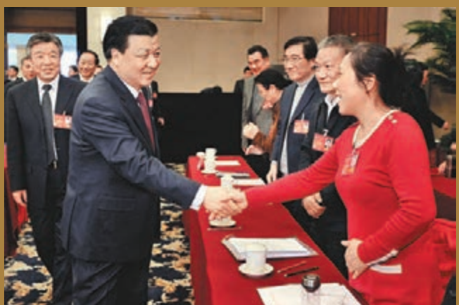
■昨日下午，全國政協十二屆二次會議社科、新聞出版界別聯組會在北京舉行，劉雲山參加會議並聽取委員們的提案建議。圖為劉雲山與委員們握手。