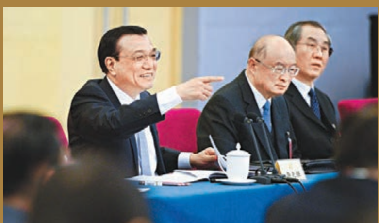
▶李克強昨日出席全國政協會議並參加分組討論。

程之長難以想像。很多國外企業反映，想到上海設立亞太研發、銷售中心，但進駐上海很難，需要審批，一個項目要蓋100多個章，因而放棄進入上海。所以政府下決心在上海設立自貿區，不單單是為了海外監管便利化、實現通關順暢，更重要的是要簡政放權，營造公平競爭的環境。