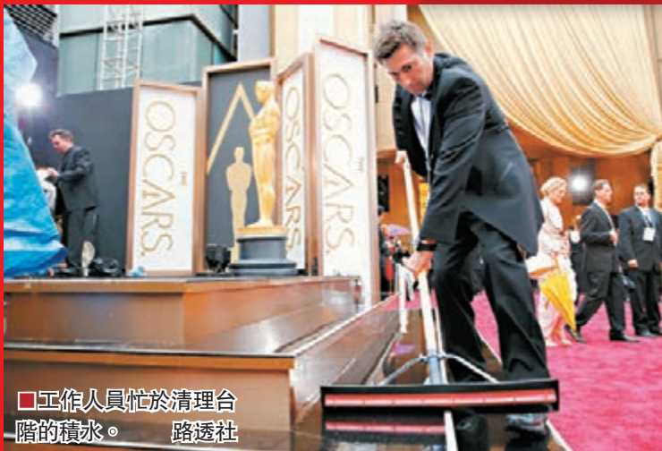
工作人員忙於清理台階的積水。