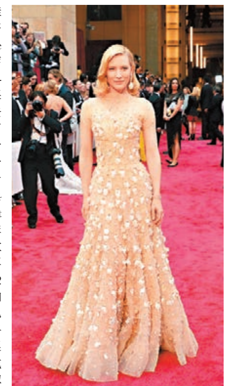
剛榮獲最佳女主角的姬蒂白蘭芝 (Cate Blanchett) 穿上Giorgio Armani亮片裸色長禮服登場，大量閃石綴於綉紗裙身上。而她全身佩戴約86卡的蕭邦2014 Red Carpet系列全新珠寶，分別是歐泊吊墜白金耳環，鑲有62枚白色歐泊 (33卡)、啡色鑽石白金手鐲 (49卡) 及梨形鑽石白金戒指 (4卡)，認真閃爆。