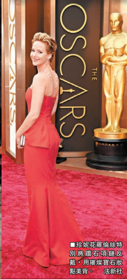
珍妮花羅倫絲特別將鑽石項鍊反戴，用璀璨寶石妝點美背。