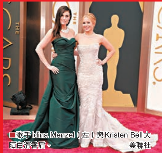
歌手Idina Menzel (左) 與Kristen Bell大晒白滑香肩。