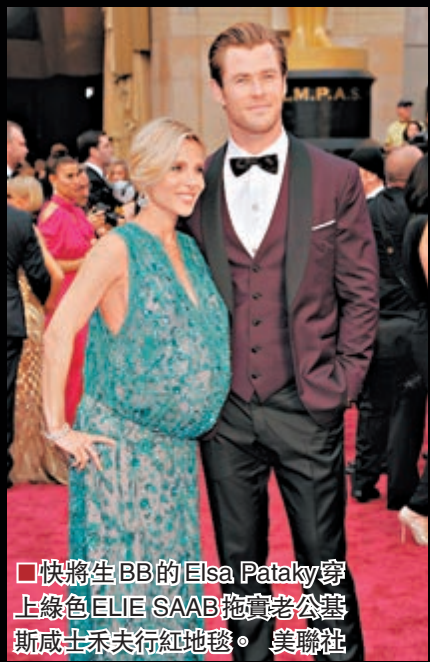
快將生BB的Elsa Pataky穿上綠色ELIE SAAB拖實老公畢斯威士夫夫行紅地毯。

與往年相同，今年的奧斯卡頒獎典禮最受矚目的還是眾明星走紅毯的鏡頭，今年依舊在荷里活大道上走紅毯，儘管這兩天洛杉磯天候不佳，但主辦單位不僅設置遮雨棚，甚至還用層層的塑膠布先蓋住紅毯，避免紅毯遭雨淋濕，足夠令各位盛裝打扮的女星在賽前爭妍鬥艷。