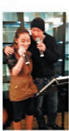
60 likes nikkieleung Dream come true <3 #favoritesinger#itthinkwasdreaming#singing#amcometrue#onceinalifetime#hongkong# 梁家輝大女將與學友唱K的照片放上網。