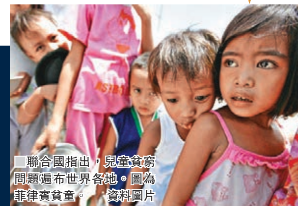
聯合國指出，兒童貧窮問題遍布世界各地。圖為菲律賓貧童。 資料圖片