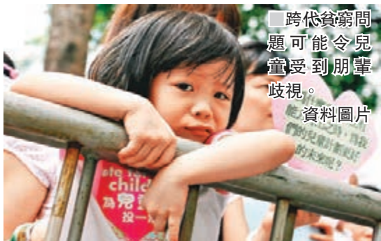
跨代貧窮問題可能令兒童受到朋輩歧視。