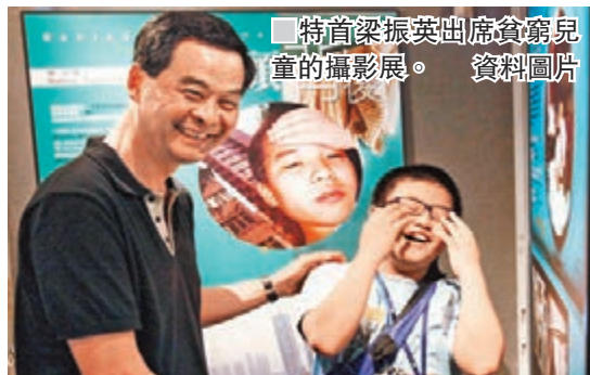
特首梁振英出席貧窮兒童的攝影展。