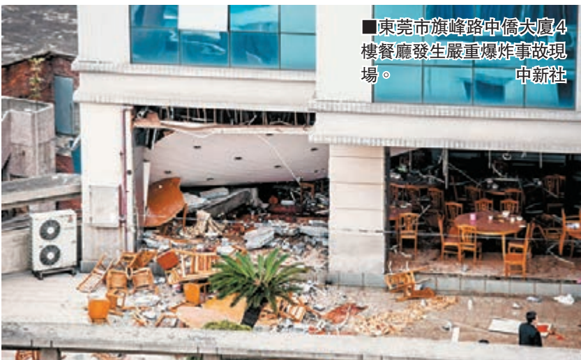
東莞市旗峰路中僑大廈4樓餐廳發生嚴重爆炸事故現場。

中山大學附屬東華醫院值班醫生表示，22名輕傷者都已得到初步治療，病情穩定，輕傷者中包括一名懷孕三個月孕婦，胎兒暫未受影響。經東莞警方初步調查，爆炸是石化員工食堂廚房燃氣洩漏導致。