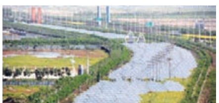
■中新生態城地面光伏發電項目。

少排放二氧化碳11000噸，二氧化硫50噸。目前，在生態城範圍內建設實施的公共建築類可再生能源光伏項目共有七個。