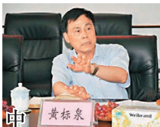
中山人大常委會副主任黃標泉。