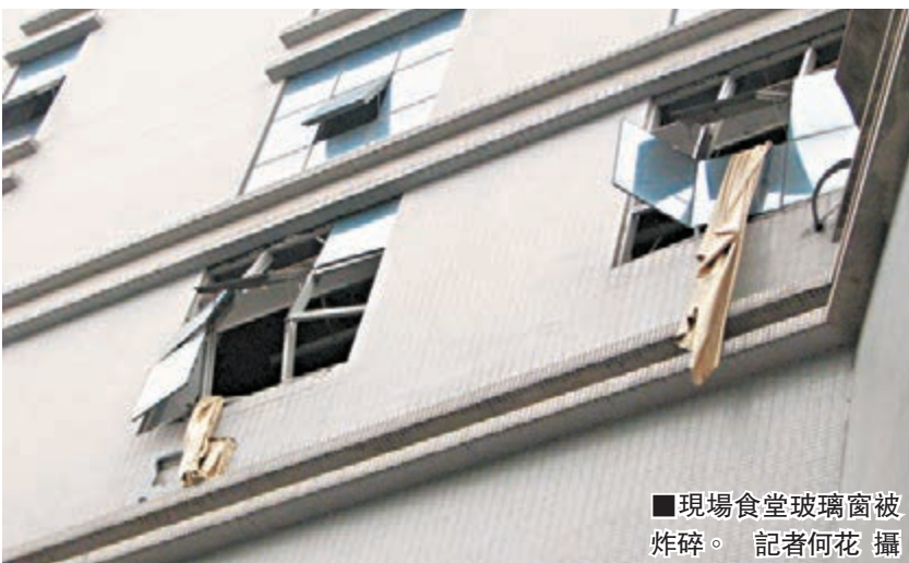
現場食堂玻璃窗被炸碎。