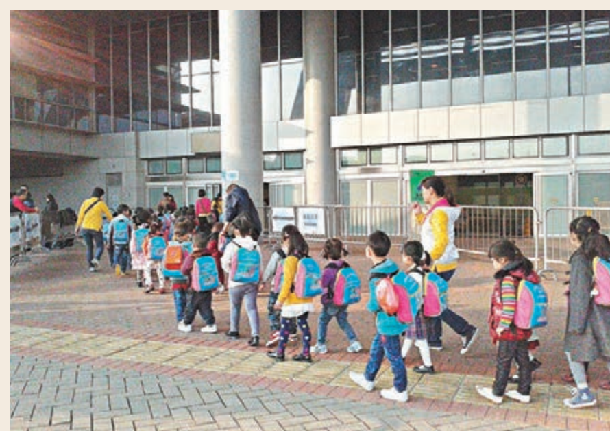
跨境學童問題亟待兩地合作解決。資料圖片

李少光續說,相關交流活動可以借鑒保安局下屬的醫療輔助隊、民眾安全服務隊等志願者團體的模式,吸引年輕人參與。他相信建立對年輕人具有吸引力的志願者組織和激勵機制,有助於讓愛國信念深入人心,增強香港青年的國家認同感。