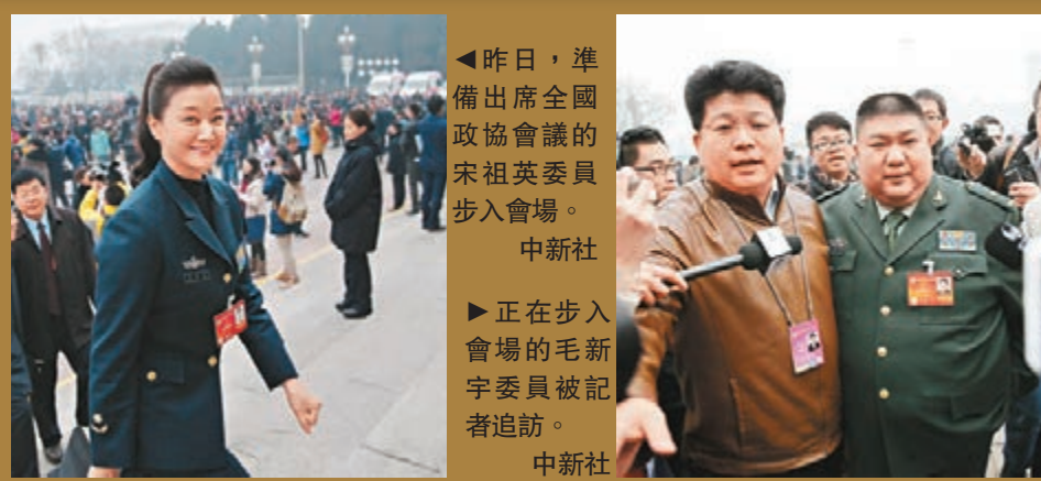
◀昨日，準備出席全國政協會議的宋祖英委員步入會場。