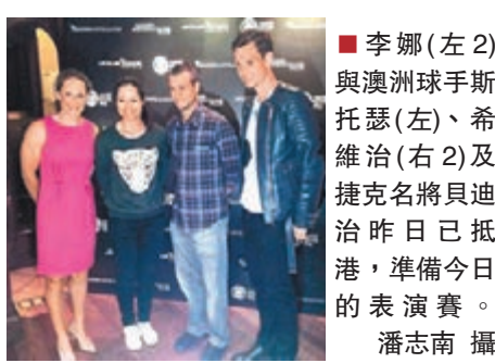
李娜(左2)與澳洲球手托瑟(左)、希維治(右2)及捷克名將貝迪治昨日已抵港，準備今日的表演賽。

另外，2014香港網球公開賽賽會昨日宣布，目前女單世界排名第2位的2項大滿貫冠軍得主李娜以賽期頻繁為由，已婉拒參賽，不過另一國家隊球手、新任女雙世界第一組彭帥則答應9月來港出戰，她說：