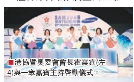
港協暨奧委會會長霍震霆(左4)與一眾嘉賓主持啓動儀式。

第57屆體育節昨日假伊利沙伯體育館舉行開幕典禮，體育節大使女子滑浪風帆選手陳曉文應邀出席，參與健康操示範和分享做運動的樂趣，推廣「全民運動」的訊息。第57屆體育節於3月至6月期間舉行，在全港各區舉辦約80項多元化的體育活動供不同年齡和性別的市民參加。