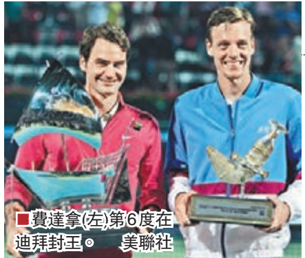
費達拿(左)第6度在迪拜封王。

「瑞士天王」費達拿回勇了，上周六在迪拜公開賽決賽，在先失首盤3:6的劣勢下，連勝2盤6:4和6:3，以總盤數2:1逆轉擊敗捷克名將貝迪治，第6度在迪拜封王，也是其職業生涯第78個單打冠軍，錦標總數升上史上第3位。