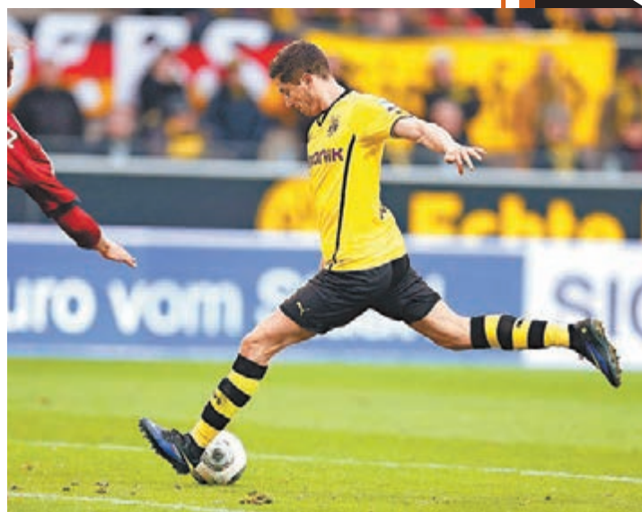
■利雲度夫斯基起腳破門。