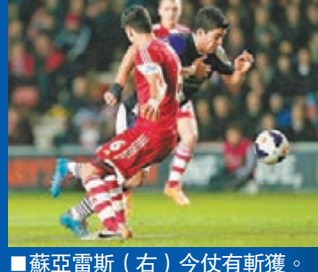
■蘇亞雷斯(右)今仗有新獲。