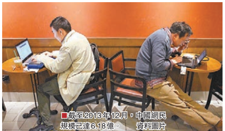
■截至2013年12月，中國網民規模已達6.18億。資料圖片

全國政協常委、復旦大學圖書館館長葛劍雄在接受本報採訪時指出，出台法律法規應當針對「現象」，而不是針對「類型」，「如果造謠，法律應該針對造謠，如果涉黃，法律就針對涉黃，而不是針對『大V』，無論『大V』、『小V』，只要觸犯法律，應當一視同仁，如果沒有觸犯法律，就交給其他網民。」