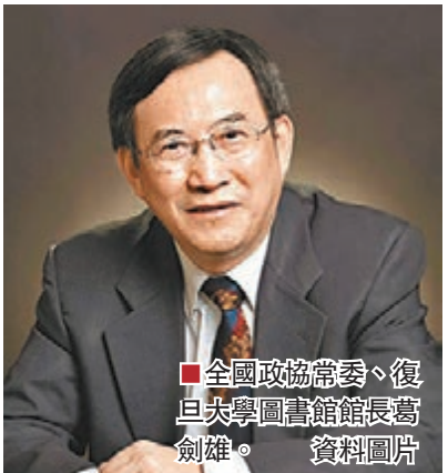
■全國政協常委、復旦大學圖書館館長葛劍雄。