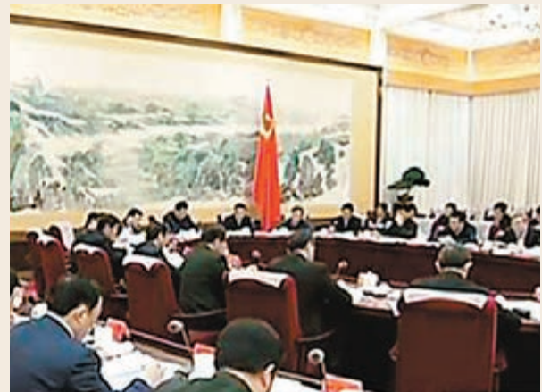
■中央網絡安全和信息化小組日前成立，並由習近平任組長。網上圖片

此前有專家建議，中國的基礎設施基本上都有一部行業基本法，如郵政法、鐵路法等，但缺電信法和廣電法，當前尤為需要網絡與信息安全法和個人信息保護法。此外，信息安全的監管也需要有法律來界定，應明確規定信息監管的適用對象，把監管納入法制軌道，既要打擊網絡犯罪，又要保障公民的言論自由，同時要塑造一個良性的有機的立法環境，在立法層面需要考慮如何讓社會各類主體參與到網絡社會的管理和建設。