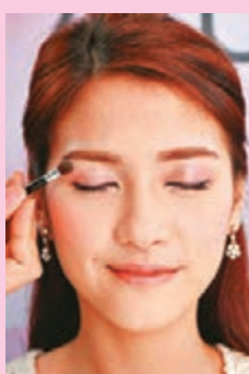
Step 1 將(1)光色塗抹到整個眼簾，並加強於眉骨位置塗抹，產生立體光感。

至於雙眼皮的你，本身已擁有一雙明亮眼睛，只要稍為修飾已可以很美，同樣地使用同款眼影組合，但主要是兩種顏色塗抹位置不同，效果就完全不一樣。