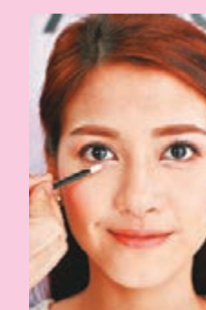
Step 5 以尖頭眼影棒(5)勾畫下眼線，從眼頭開始至3分之2的位置，營造明亮有神的效果。