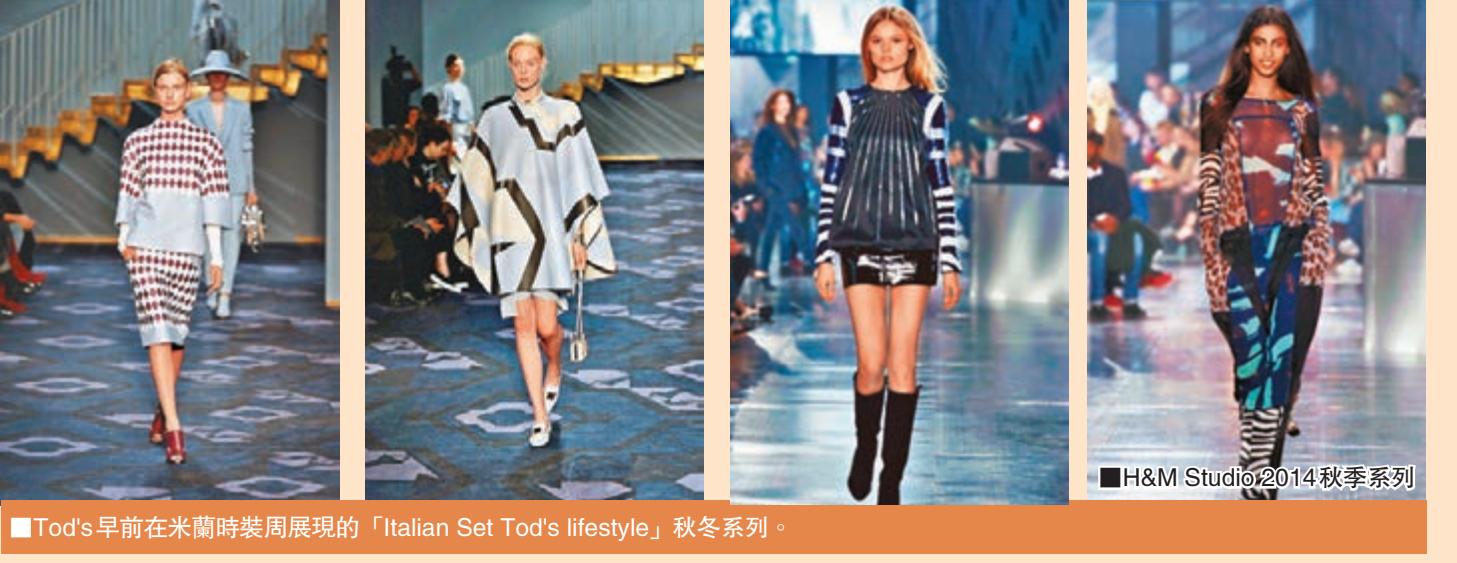
■ H&M Studio 2014秋季系列

Paul Smith 2014年秋冬系列解構傳統男服剪裁工藝，將女性嫵媚注入修身外套、剪裁利落的禮服式家居長褲及對比色拼縫西裝外套。色調偏向 Hendrix 式迷幻搖滾風，明亮而不浮誇，鮮粉紅以單藍調和，芥末黃與藍藍碰撞，藍綠及金色條紋相間。色調隨後變得更深，酒紅與墨綠交匯，紫色配襯砲銅灰。