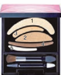
■看圖顯示強調顏色所在

如果你是單眼皮或內雙眼皮的，你不妨根據 Gary 所介紹的使用「垂直大眼塗抹法」來化眼妝。