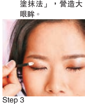
Step 3 以白色眼影棒，將(3)「強調色」塗抹到(1)和(2)的交界處，重疊滲透出眼妝主色。