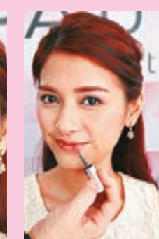
Step 6 塗抹修護精華唇膏限定色#RD667(淡紅)，令雙唇透出潤澤嫩紅感覺。