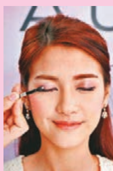
Step 2 將(3)「強調色」塗抹整個眼窩，為眼睛帶來柔和色澤。