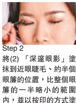
Step 2 將(2)「深邃眼影」塗抹到近眼睫毛、約半個眼簾的位置，比整個眼簾的一半略小的範圍內，並以按印的方式塗抹，塑造出更持久濃厚及深邃的效果，令眼妝變得明顯及眼睛更圓大，亦能消除浮腫感覺。