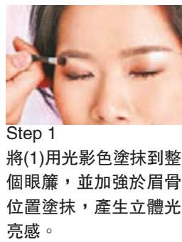
Step 1 將(1)用光色塗抹到整個眼簾，並加強於眉骨位置塗抹，產生立體光感。