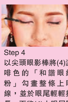
Step 4 以尖頭眼影棒將(4)濃啡色的「和諧眼線粉」勾畫整條上眼線，並於眼尾輕輕拉長。再將(4)由眼尾開始，深至淺地塗抹3分2的下眼線，令眼睛更圓大。注意將眼線邊緣微微混開，令稍粗的眼線看來更自然。