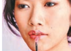
Step 6 塗抹修護精華唇膏限定色#PK267(粉紅)，滋潤乾燥唇部肌膚，拉平唇紋，塑造出無紋潤澤的櫻唇。