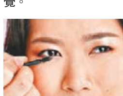
Step 5 以尖頭眼影棒(5)勾畫下眼線，從眼頭開始至3分之2的位置，營造明亮有神的效果。