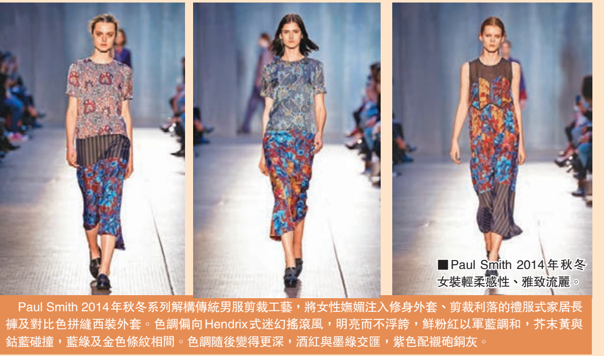
■ Paul Smith 2014年秋冬女裝輕柔感性、雅致流麗。

隨著倫敦、巴黎、米蘭時裝周舉行後，不少品牌均展現了一場今年全新秋冬系列，筆者發現有些依然較為沉色系列，但卻有不少品牌採用鮮艷顏色配搭。而 H&M Studio 2014 秋季系列時裝秀早前已在巴黎時裝周登場，品牌體現廿一世紀隨意優雅風格和成熟韻味，糅合女性剛柔並重的獨特氣質。