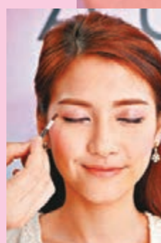
Step 3 將(3)「深邃眼影」塗抹到眼尾位置，塑造出立體的輪廓。