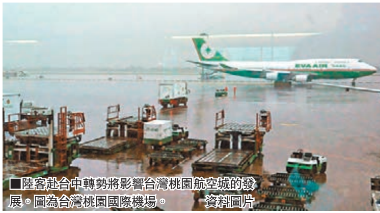
陸客赴台中轉勢將影響台灣桃園航空城的發展。圖為台灣桃園國際機場。資料圖片

香港文匯報訊 據台灣《聯合報》報導，台灣「行政院長」江宜樺日前表示，陸客來台中轉攸關桃園航空城的成敗，有助台灣航空產業發展，台灣可望成為國際空運轉運中心，且對台灣經濟發展有指標性意義，「一定要成功」。他指示相關單位，應於兩個月內完成兩岸協商陸客中轉前的準備。陸委會副主委張顯耀指出，不只台灣方面希望陸客中轉，大陸目前空域過度擁擠，包括上海及北京等轉運旅客飽和，如果能透過桃園航空城中轉陸客，也可疏解大陸沿海第一線航空站擁擠的情況，對兩岸雙方都有利。