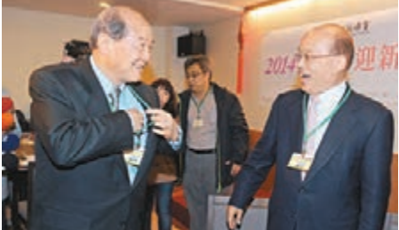
民進黨主席蘇貞昌(前右)昨日出席公開場合表示，有意參選台北市長的黨員提出看法是正常健康的。中央社

中社社報，民進黨主席蘇貞昌(前右)昨日出席公開場合表示，有意參選台北市長的黨員提出看法是正常健康的。中央社