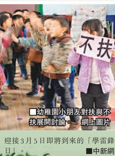
幼稚園小朋友對扶與不扶展開討論。

上月28日，河南安陽市某幼稚園的小朋友表演情景劇《扶不扶》。當日，該幼稚園開展了「老人摔倒扶不扶」主題教育活動，通過情景再現、正反辯論、教師正面教育等形式，引導小朋友對社會中出現的問題樹立正確的認識，傳承中華民族的傳統美德。