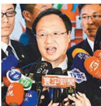
江宜樺日前表示，陸客來台中轉對台灣經濟發展有指標性意義，「一定要成功」。

江揆表示，兩岸協商涉及雙方各自關切事項，每一次的協商都不是件容易的事，未來兩岸協商將更複雜艱鉅，挑戰也愈來愈多。