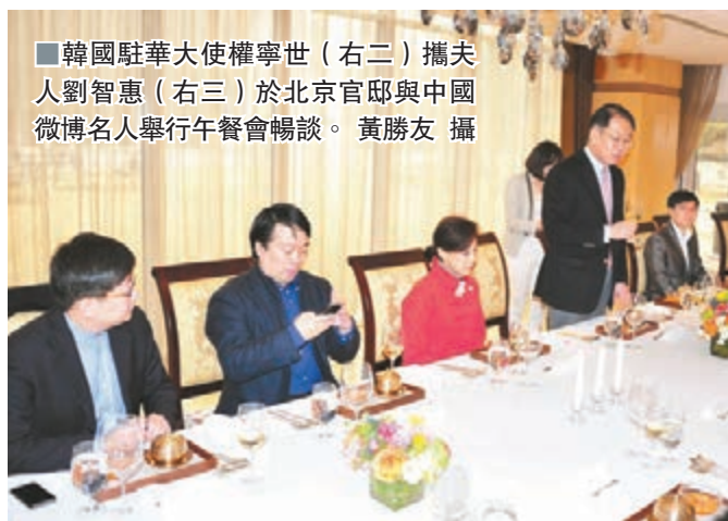
韓國駐華大使權寧世(右二)攜夫人劉智惠(右三)於北京官邸與中國微博名人舉行午餐會暢談。

談及朝鮮問題,權寧世表示,韓國與中國能攜手努力的方面有很多,亦非常重要。南北離散家屬團聚、高層對話已有很好的徵兆,韓國會用耐心與毅力維持這種好的趨勢。