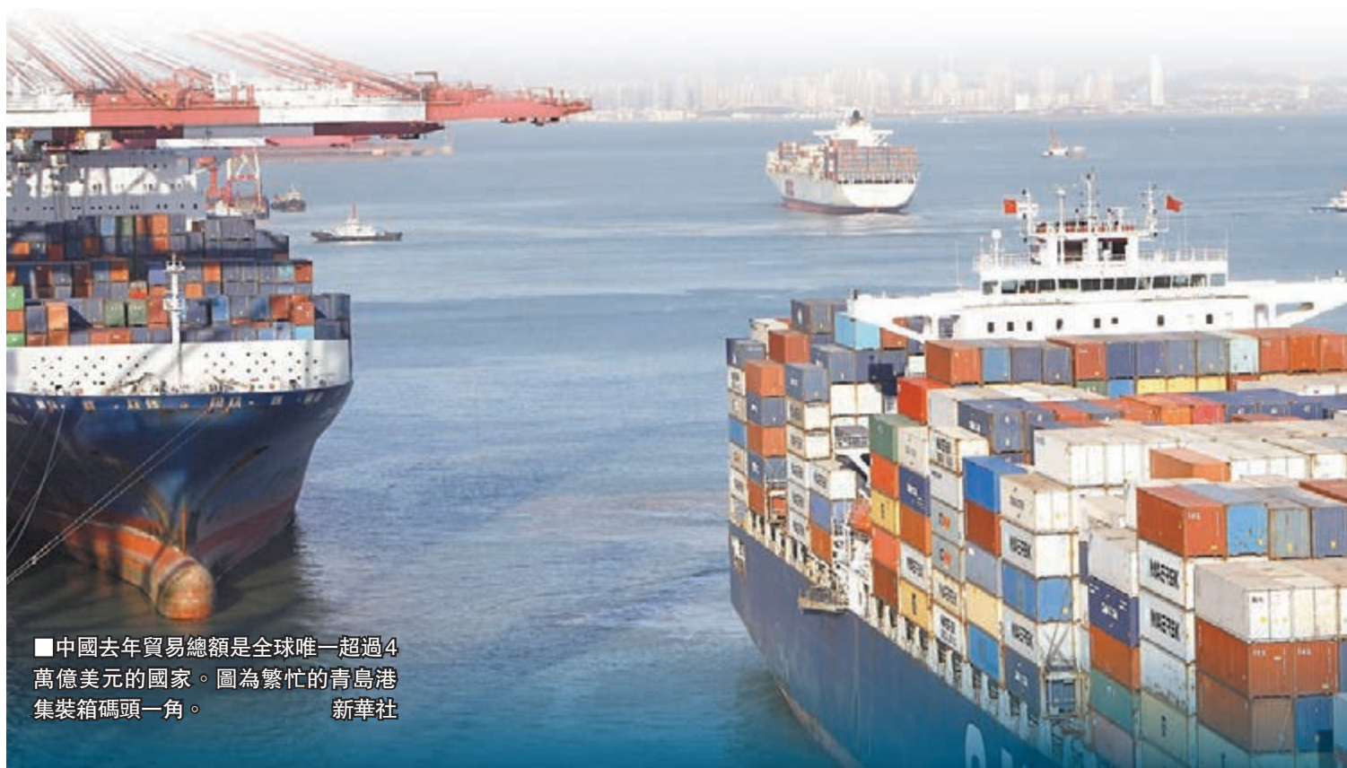
中國去年貿易總額是全球唯一超過4萬億美元的國家。圖為繁忙的青島港集裝箱碼頭一角。

中國社科院財經戰略研究院服務貿易與WTO研究室主任于立新認為,前30年我們在貨物貿易方面打了勝仗,但非常遺憾,我們服務貿易是逆差。要想成為貿易強國,服務貿易必須打翻身仗,未來30年中國發展空間在服務貿易。