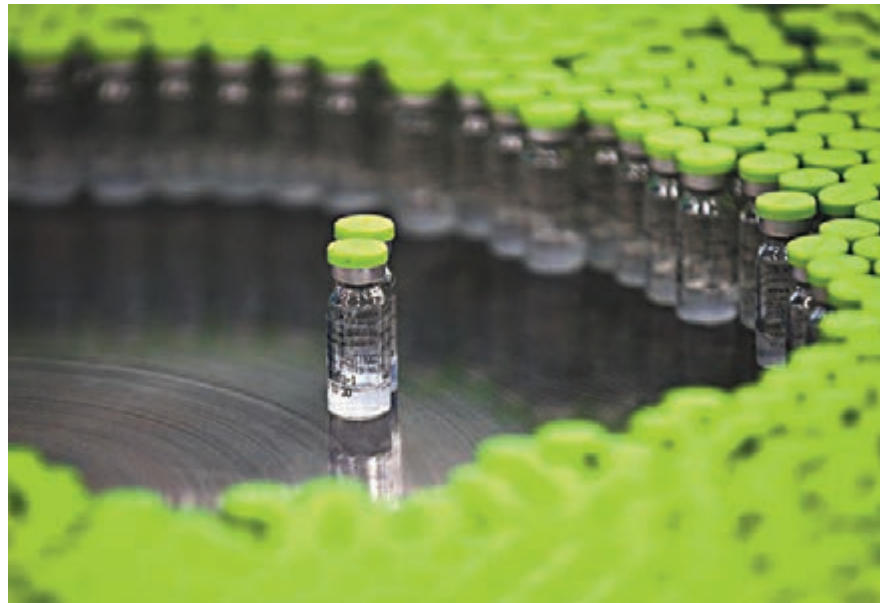
圖為內地生物醫藥生產商生產的H1N1疫苗。 資料圖片

即使納斯達克生科技指數 (NBI) 2009年低點至今更上漲超過3倍，而新藥開發時間相當漫長、投資金額也相對龐大，但由於人口老化生醫療需求長線升溫，只要新藥一旦研發成功、順利上市推廣，後續享有相當可觀毛利率的產品專利期，讓開發新藥企業的股價水漲船高。