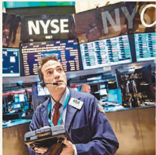
分析對今年美股前景表樂觀。圖為紐交所的交易員。

今年來生物科技及科技股延續強勢，納斯達克指數2/26日更再創14年新高，展望三月份生技產業題材眾多，除了大型生技股Celgene及Vertex旗下有藥品審核題材之外，美國皮膚科醫學會年會(AAD)(3月21日至25日)、瑞士信貸及巴克萊資本亦將舉行健康醫療產業研討會，歷史經驗統計，醫學會或醫療產業研討會舉辦期間，多有調升獲利展望或投資評等之利多可期，有助推升生技股續創高峰，而科技股可留意德國漢諾威電腦展(CeBIT，3月10日至3月14日)，看好4G LTE無線通訊設備、巨量資料、雲端運算、軟體服務、社群網路、物聯網等題材暢旺。建議已進場投資者不預設高點，採取續抱及定期定額策略，積極參與雙軌創新產業的龐大商機。