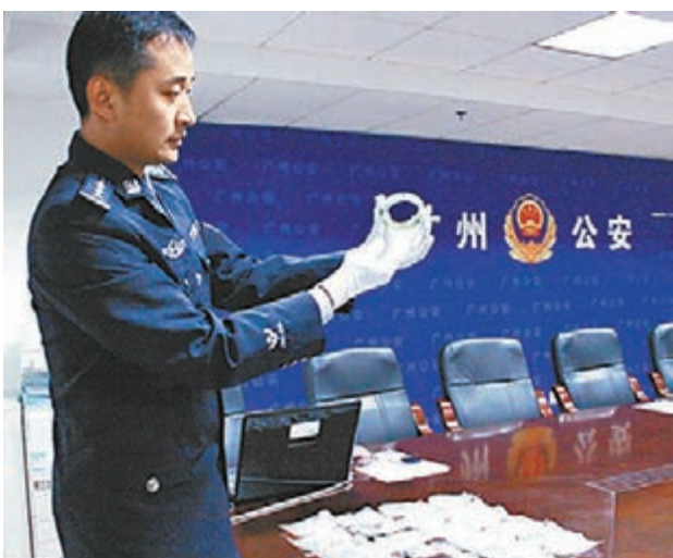
警方展示被盜的玉器。

香港文匯報訊(記者 敖敏輝 廣州報道)在破獲一起百萬黃金失竊案後,廣州警方近日再破獲一起價值180萬玉器失竊案。犯罪嫌疑人在多個房地產中介公司工作,利用地產中介的身份,暗記住宅和商舖位置,偷了原東家