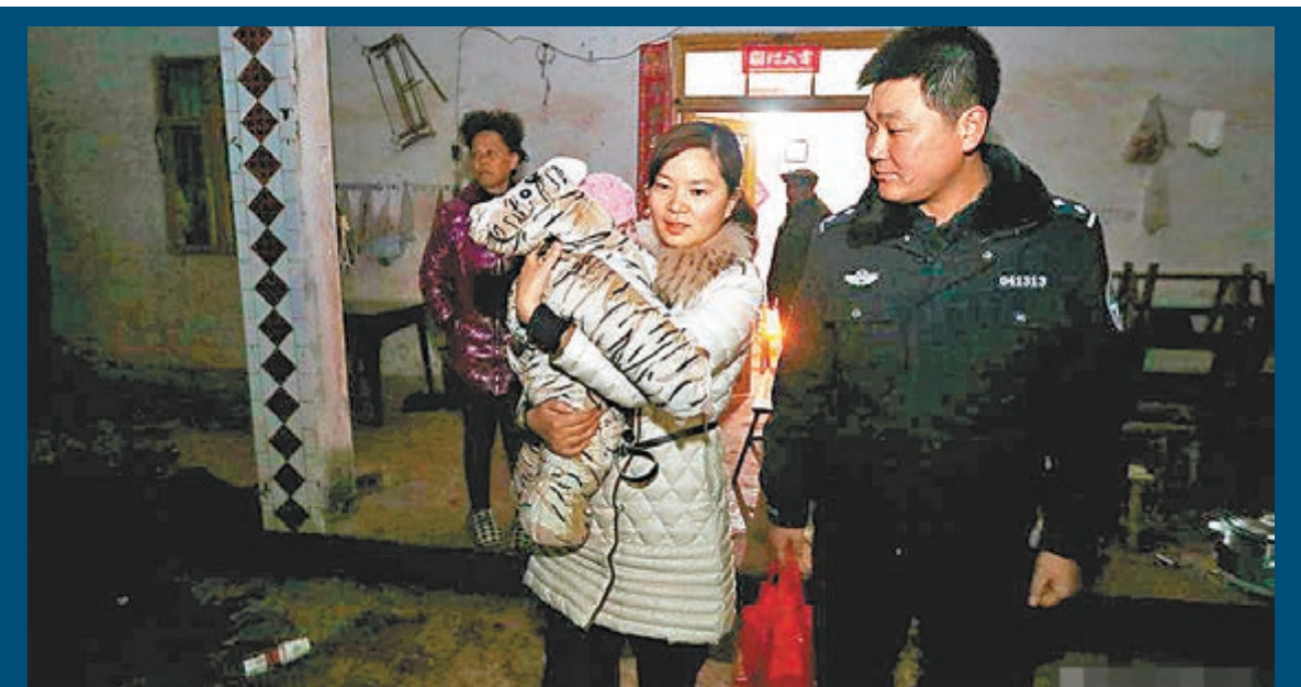
27省市警方統一行動,摧毀4個特大網絡販嬰集團。圖為四川民警解救出一名不到一歲的女嬰。