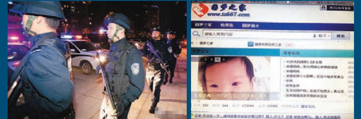
四川省自貢市民警參加抓捕解救行動。涉案網站仍有收養信息發佈。