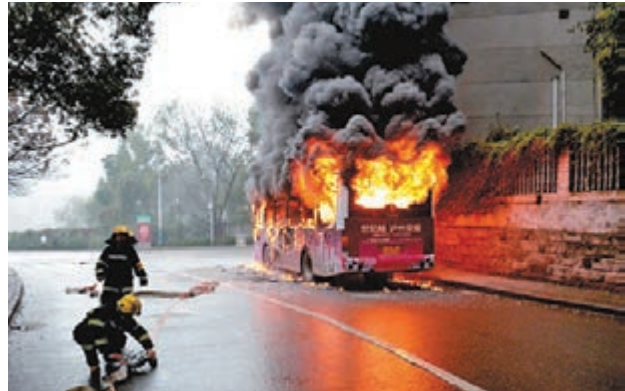
瀘州市城區一輛巴士起火燃燒,消防官兵抵達現場進行滅火。

香港文匯報訊(記者 劉銳、濮沁、高施倩,實習記者 周方怡 綜合報道)繼貴陽巴士行駛中起火事件外,四川、浙江也相繼發生巴士自燃事故,幸虧車上乘客獲得及時疏散,暫時未有人員傷亡報告。