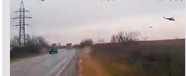
■網上流傳俄國直升機飛越克里米亞領空的片段。網上圖片

針對近期烏克蘭克里米亞部分民眾示威遊行要求獨立一事，中國外交部發言人秦剛昨表示，中方尊重烏克蘭領土和主權完整的立場是一貫的，相信烏克蘭人民能夠解決國家面臨的問題。 ■美聯社/法新社/彭博通訊社/《衛報》