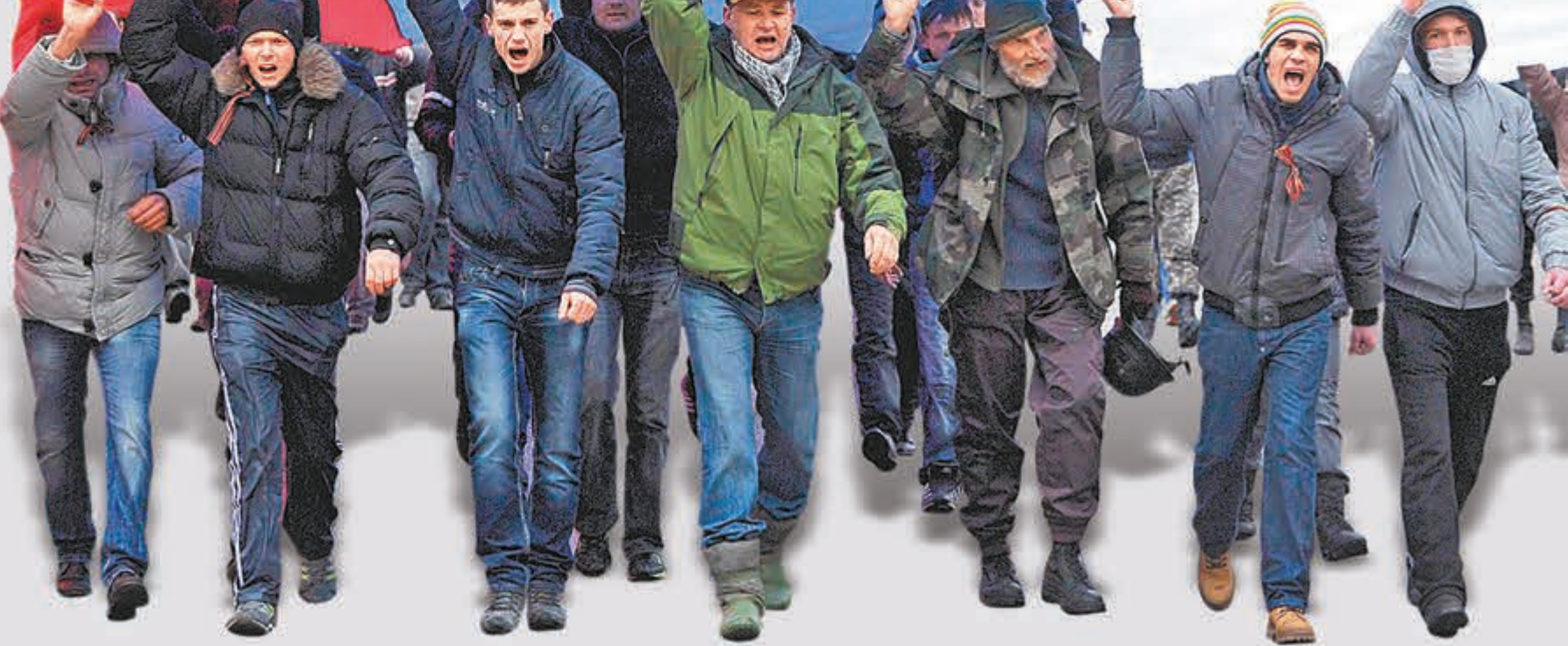
■武裝分子在辛菲羅波爾機場外巡邏。法新社

烏克蘭本幣格里夫納匯價持續創新低，為防止資金進一步外流，烏克蘭央行昨日宣布實施提款限制，即日起每人每日只能從銀行提取1.5萬格里夫納(約1.2萬港元)。行長庫比夫強調，烏克蘭目前仍然有足夠財政儲備償還債務，不會違約。央行同時禁止不交收外匯逾期合約，以支持格里夫納匯價。庫比夫又不點名提到16家銀行，指央行將調查它們是否涉及非法炒賣。 ■法新社/路透社