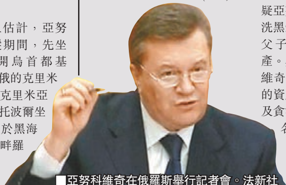
■亞努科維奇在俄羅斯舉行記者會。法新社

俄羅斯總統普京下令政府重啟與烏政府的經濟及貿易談判，並呼籲國際對烏施以援手，下令政府考慮克里米亞提出的人道援助請求。 ■路透社/法新社/俄新社