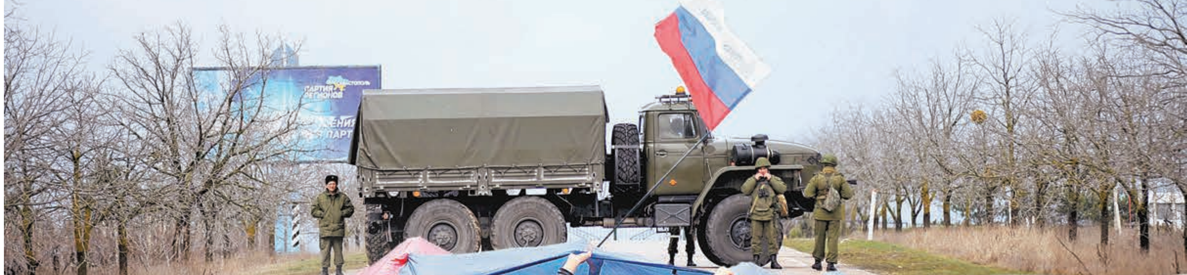
■武裝分子堵塞通往塞瓦斯托波爾機場的道路。