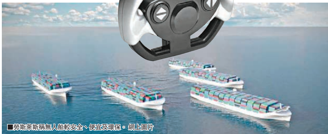
勞斯萊斯稱無人船較安全、便宜及環保。

勞斯萊斯有新搞作，不是新跑車，也不是新引擎，而是可以在千里之外遙控駕駛的無人貨櫃船。公司指無人船較安全、便宜及環保，有望10年內在波羅的海等區域下水，不過無人船目前並不符合國際海事法，有人擔心一旦廣泛應用會造成大量海員失業。