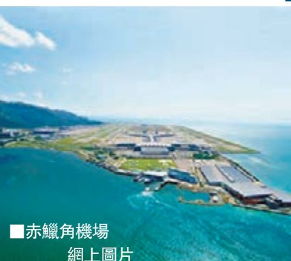
赤鱗角機場 網上圖片

剛舉辦完冬奧的俄羅斯索契，機場雖然無太大特色，但降落時乘客可從黑海上空飽覽城市與奧運場館景色而入圍。在馬爾代夫的易卜拉欣·納西爾國際機場，乘客能從客機上俯瞰當地數千個小島，感受藍天碧海的度假氣息。 ■《每日郵報》