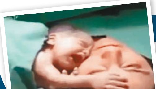
嬰兒將小手放在母親額頭。

一段母子情深的短片近日熱爆網絡，片中一名初生嬰兒被護士抱到筋疲力竭的母親身旁時，立刻用小手抱住媽媽的臉頰，每當護士企圖扳開其小手便會大喊大叫，顯然不想和母親分開。媽媽見到孩子這樣黏着自己，也不禁莞爾，護士最終將嬰兒抱開帶去洗澡。影片至今已看過百萬次點擊率。 ■綜合報道