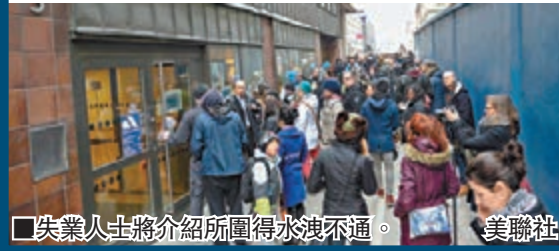
失業人士將介紹所圍得水洩不通。