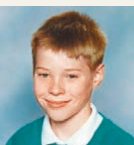
埃文斯兒時滿臉雀斑。