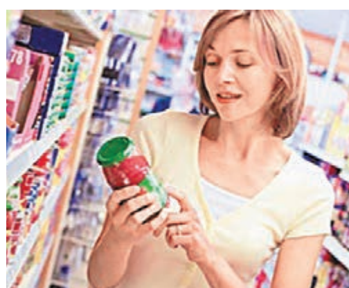
華府修訂食物標籤後，民眾購買健康食品時將更方便。