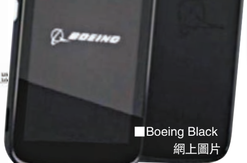
Boeing Black 網上圖片

波音日前向美國聯邦通訊委員會提交文件，標榜新機是美國製造，採用雙卡設計，搭載加密版本的Android系統，長13.2厘米、闊6.9厘米，略大過蘋果iPhone，可支援HDMI電視輸出。