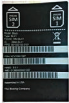
手機採雙卡設計。

美國飛機製造商波音正研發占士邦式超加密智能手機 Boeing Black，目標顧客為任職國防或國土安全相關部門的官員，新機除能加密通話內容外，若有人強行打開機殼時，更會自動刪除所有儲存資料，變成「廢機」。