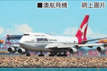
澳航飛機

澳洲航空公司昨宣布，由於嚴重虧損，去年下半年虧損達2.35億澳元(約16.3億港元)，按年轉盈為虧，決定3年內裁員5,000人，佔總員工1/6，期望節省20億澳元(約138.5億港元)，總裁喬伊斯將尋求澳洲政府援助。消息傳出後，澳航股價大瀉7.1%。工會大表不滿，認為澳航決策錯誤令員工遭殃，抨擊公司短視近利。