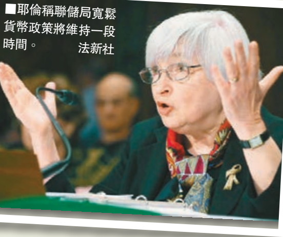
耶倫稱聯儲局寬鬆貨幣政策將維持一段時間。

歐股偏軟，英國富時100指數中段報6,791點，跌7點；法國CAC指數報4,387點，跌9點；德國DAX指數報9,566點，跌95點。