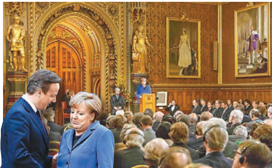
默克爾昨在英國國會發表演說，是東西德統一以來首名在該議事廳發言的總理。

德國總理默克爾昨在英國國會發表演說，是東西德統一以來首名在該議事廳發言的總理。她敦促英國切勿脫離歐盟，亦未支持英國首相卡梅倫主張改革歐盟。