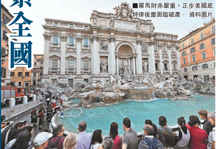
羅馬財赤嚴重，正步美國底特律後塵面臨破產。