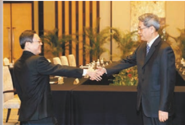
劉遵義認為，「張王會」是兩岸關係一大突破。 資料圖片