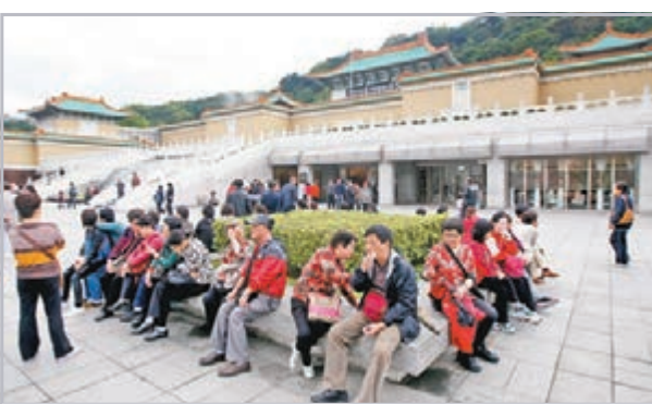
劉遵義指台灣接待陸客還有很大發展空間。圖為台灣故宮博物院外的大陸遊客。 資料圖片

台的平台，就如以前台資到大陸投資也是化身港資公司。他也向港台雙方建議，香港和台灣可簽訂避免雙重課稅協定，以吸引更多陸資，特別是大陸民間資本去台灣投資，互惠互利。