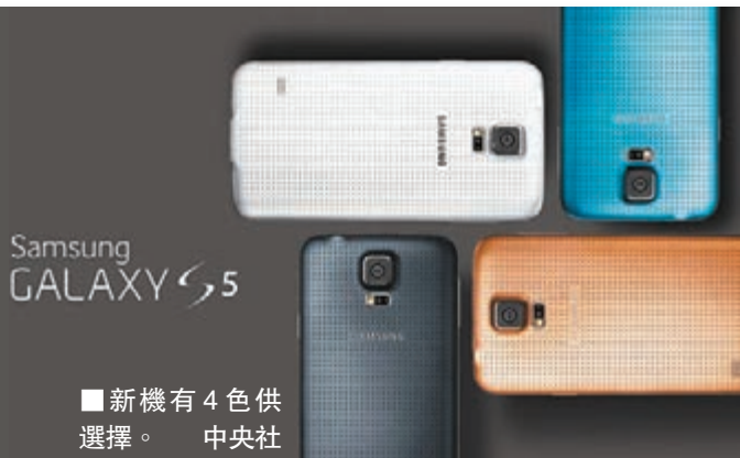
新機有4色供選擇。