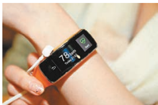
Gear Fit 智能手帶可測用家心跳。

三星同場公開3款新智能穿戴裝置，除早前已亮相的Galaxy Gear 2和Gear Neo外，還有新成員智能手帶Gear Fit。主打健康功能的Fit採用曲面屏，設有通知、計步和計時功能，並搭載感應器監測用家心跳和身體狀況，可與S5手機聯動。