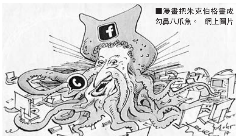
漫畫把朱克伯格畫成勾鼻八爪魚。網上圖片