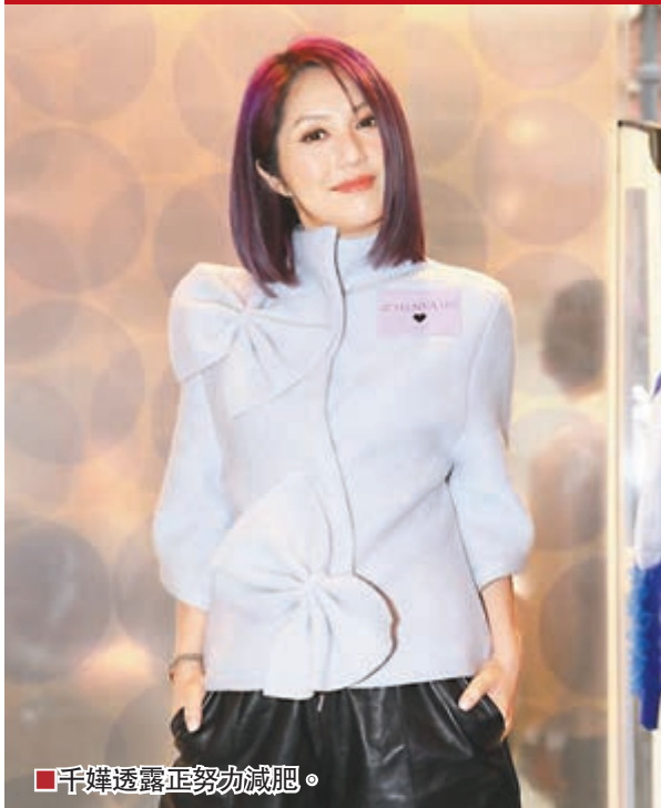
■千嬅透露正努力減肥。