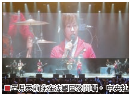
■五月天前晚在法國巴黎開唱。

香港文匯報訊(記者凡文) 台灣樂團五月天的「諾亞方舟」世界巡迴演唱會前晚在法國巴黎開唱，4000多名歌迷把場館染成藍色熒光海。現場也有不少外籍聽眾，有法國歌迷認為，五月天的演唱會籌備團隊很用心地把歌詞翻譯成英語和法語，有助歐洲人理解，旋律也容易記憶，日本瘋和韓流都曾相繼吹到歐洲，從五月天開始，華語流行音樂在歐洲也有可為。演唱會結束後，五月天受訪時表示，這是「諾亞方舟」第75場演唱會，他們想要藉演唱會主題，鼓勵大家把握當下、熱愛生命。