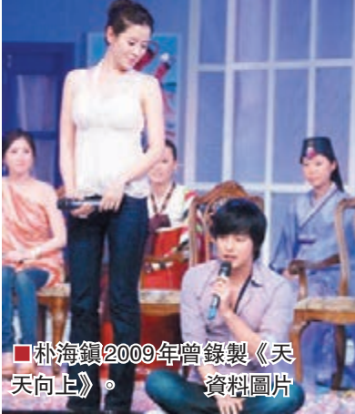
■朴海鎮2009年曾錄製《天天向上》。

香港文匯報訊(記者董曉楠) 湖南衛視《快樂大本營》節目組昨日透露，熱播韓劇《來自星星的你》中飾演男配角李輝京的朴海鎮應邀出演節目。特輯將於下月11日進行錄製，並於下月22日播出。