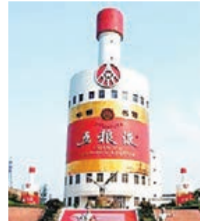
四川龍頭民企之一宜賓五糧液集團。

四川 香港文匯報訊(記者李兵成都報導)日前,四川省經信委透露,今年四川省計劃完成技術改造投資5000億元,着力推動完成7700億元工業的投資目標。據悉,四川省將充分發揮技術改造投資調存量、擴增量的雙重作用,以壯大七大優勢產業、培育六大新興產業、改造提升傳統產業為切入點,推動技術結構和產品結構調整,帶動和助推產業結構優化。四川省積極擴大優勢產業和新興產業投資,抑制產能過剩行業和「兩高」行業投資,促進投資要素向優勢產業、龍頭企業、重點項目和關鍵技術集結。今年,四川將重點推動實施500個投資上億元的技改及工業項目,總投資4500億元;力爭完成1000億元投資計劃,特別是抓好列入省政府重點項目計劃的項目建設。