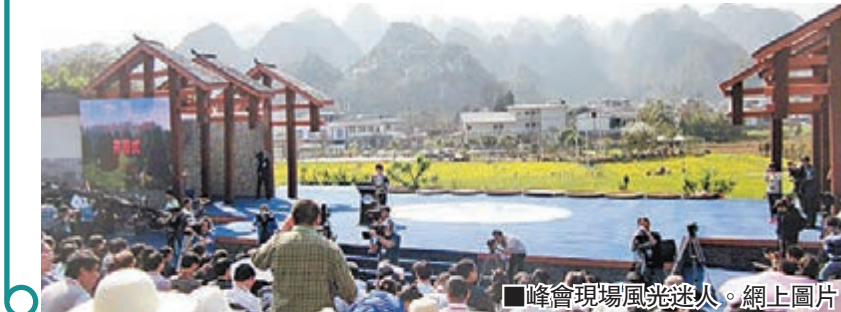
峰會現場風光迷人。

貴州 香港文匯報訊(記者虎靜貴陽報導)第二屆「中國美麗鄉村—萬峰林峰會」於昨日在黔西南州興義市開幕。來自各地的美麗鄉村代表和來自24個國家的政府要員、學者齊聚興義,就建設美麗鄉村展開討論和觀摩體驗。主會場活動於26日結束。峰會期間,與會專家學者將就美麗鄉村建設模式、新型職業農民培育、農業特色產品電子商務、生態農業項目招商建設等話題展開深入探討;聯合國教科文組織、糧農組織和國家文物局也將就美麗鄉村建設與文化遺產保護問題進行研討;農業部還將發佈「中國美麗鄉村建設模式」,開展「農產品產銷對接」等活動。同時,內地首個「中國美麗鄉村電視頻道」將同步開播,首個相關電子商務交易平台也將正式上線運營。