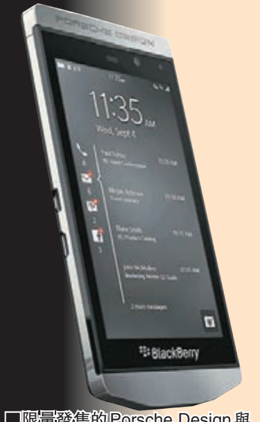
■限量發售的Porsche Design與BlackBerry的P9982手機機頂，還印有Porsche Design字樣。