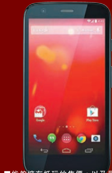
■能夠擁有抵玩的售價，以及最新的Android 4.4 KitKat選擇不多。

始終，不是每一個用家都願意付五、六千元去買智能手機，但又不想規格太差。要便宜之餘，質素也要高。所以，除了內地代表外，來自外國的Motorola也推出抵玩的手機。Moto G早前亦在香港發售，其售價為港幣1,898元。而且，由於供貨相對較穩定，要買也不用像買紅米般要去搶購。雖然是售價便宜，但操作系統採用Android 4.3，於情人節期間還可升級至最新的4.4 KitKat。就算是貴價的手機，也未必這麼快就能升級至Android 4.4。