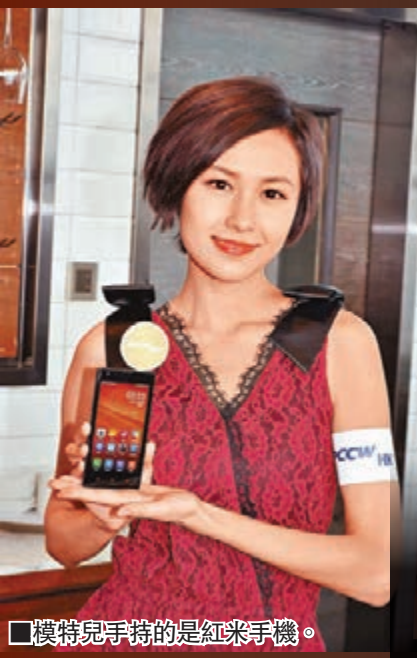
■模特兒手持的是紅米手機。