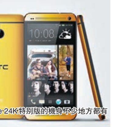
■HTC One 24K特別版的機身不少地方都有24K黃金。

剛才我們提過手機有金色版的話，感覺會更加特別。HTC其實日前也推出了限量的HTC One 24K版本，採用24K黃金。除熒幕外，機身大部分的地方都有24K黃金，盡顯尊貴。而24K黃金的顏色比起金色版感覺更好，可惜的是，這部機只用來抽獎之用，而有關抽獎目前已經結束。