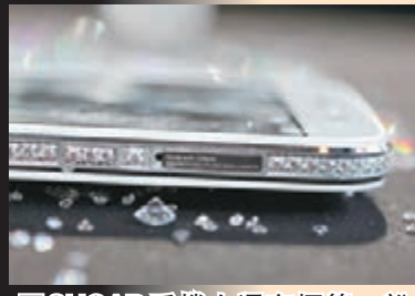
■SUGAR手機上還有標籤，說明有129顆Swarovski。

■Moto G有多款手機顏色殼讓用家更換，就像大家每天可以換衣服一樣，每天都可以不同。