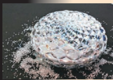
■SUGAR手機的包裝盒都與別不同，試想想用來送給女士，對方一定很喜歡。