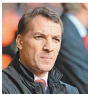
羅渣士續為前4目標奮鬥。

利物浦在足總盃16強出局後，今日將重整旗鼓，在主場迎戰史雲斯，力爭聯賽3分，繼續向前4的目標進發。紅軍主帥羅渣士賽前坦承，今季若能以前4完成，將有助球隊羅致更多球星加盟。(now621台今日9:30p.m.直播)