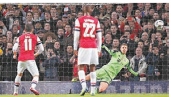
紐亞(右)認為只罰十二碼便可。資料圖片