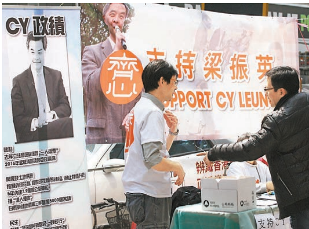
10多名身穿印有「齊心」字樣白色汗衣的網民，在灣仔地鐵站外擺街站收集簽名，支持梁振英施政。

他批評，香港社會目前太政治化，「就算街市菜價貴與梁振英有關」，故他們自發在facebook專頁「SUPPORT CY LEUNG」發起行動，希望透過收集支持簽名，呼籲市民站出來為梁振英發聲，以示對政府的支持和向政棍說「不」。他們估計，全日會收到3,000個至5,000個簽名。