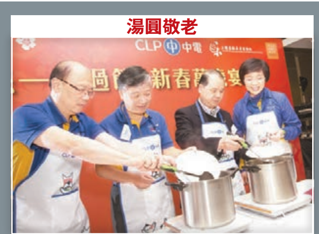
中電總裁潘偉賢(左二)和勞工及福利局局長張建宗(右二)，聯同中電營運總裁周騰輝(左一)及企業發展總裁莊偉茵(右一)，昨日為170位出席「和您一起過節」午宴的長者炮製愛心湯圓。張建宗說，英國留學時已不時到唐人街買菜入廚，蒸魚、煲湯、燒肉相當拿手，煮湯圓「無難度」。工程界出身的潘偉賢較少入廚，但基本功如煮麵等駕輕就熟。中電表示，在端午節、國慶及長者日，都會繼續舉辦類似活動，與長者共度佳節。文：文森

梁振英昨日在特區禮賓府與愛德華·羅伊斯率領的代表團會面，就雙方共同關心的課題交換意見。梁振英指出，香港與美國經貿關係密切，並歡迎更多美國企業到香港投資，又強調香港與內地關係密切，加上國際大都會的優勢，在中美的經貿關係中可以擔當「超級聯繫人」的角色，期望雙方能夠在不同範疇繼續保持緊密的交流，讓雙邊關係更上層樓。