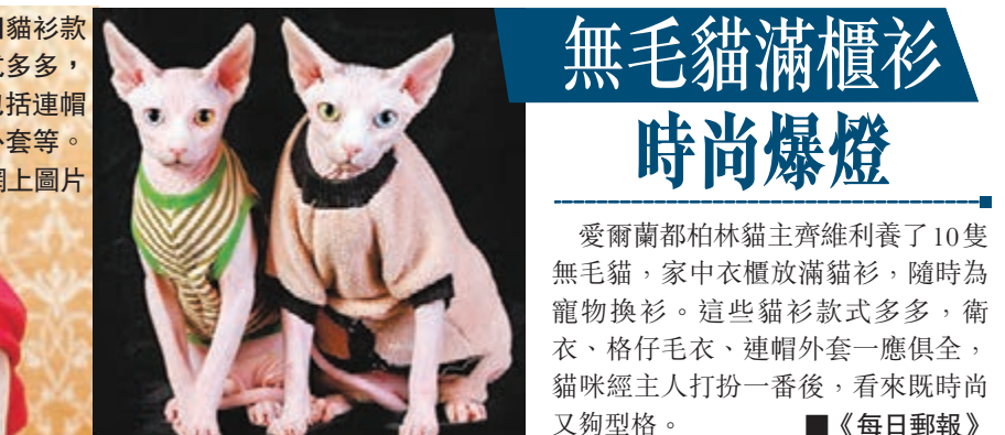
■貓衫款式多多，包括連帽外套等。