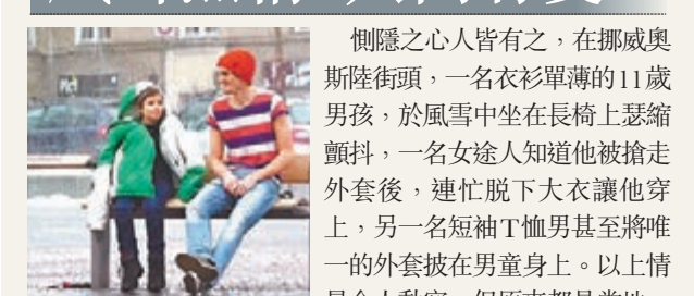
■測試發現不少途人會送上衣物。

惻隱之心人皆有之，在挪威奧斯陸街頭，一名衣衫單薄的11歲男孩，於風雪中坐在長椅上瑟縮顫抖，一名女途人知道他被搶走外套後，連忙脫下大衣讓他穿上，另一名短袖T恤男甚至將唯一的外套披在男童身上。以上情景令人動容，但原來都是當地一個慈善組織做的街頭測試。該機構為呼籲民眾捐贈衣物予飽受戰禍的敘利亞兒童，特意安排街頭測試，並連續兩日暗中拍攝過程。機構表示，測試期間只有3至4名途人視若無睹，其餘都會送上衣物和暖手袋，結果遠超預期。敘內戰爆發至今已接近3年，過百萬名兒童為逃避戰火，紛紛離鄉別井，更要在單薄的帳篷下度過寒冬。