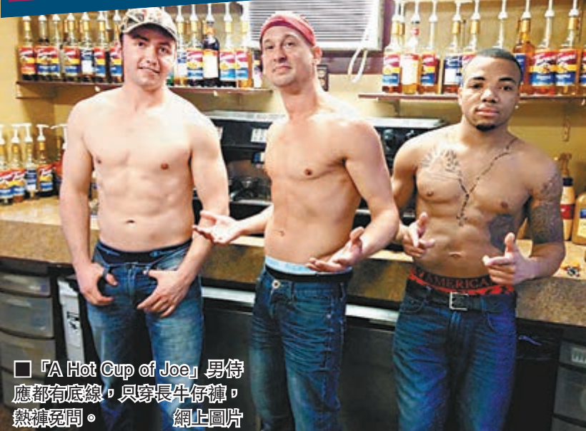
■「A Hot Cup of Joe」男侍應都有底線，只穿長牛仔褲，熱褲免問。

店內猛男個個肌肉精壯，渾身陽剛味，不過馬林斯強調侍應們都有底線，只穿長牛仔褲，熱褲免問。咖啡店舖面不大，但設有外賣窗口方便駕駛者，服務周到。馬林斯曾研究是否向男顧客提供1美元(約7.8港元)折扣優惠，不