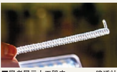
■學者展示人工肌肉。

來自美國、中國及加拿大等6國的科學家，利用普通魚絲和車衣線，製作出超強人工肌肉。它能配合溫度變化靈活收縮和伸展，可用於機械人和義肢上，並製造冬暖夏涼的智能衣服，甚至製造如電影《鐵甲奇俠》裡的護甲。