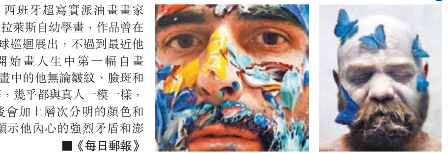
■西班牙超寫實派油畫家莫拉萊斯自幼學畫，作品曾在全球巡迴展出，不過最近他才開始畫人生中第一幅自畫像。畫中的他無論皺紋、臉斑和眼窩等，幾乎都與真人一模一樣，畫作最後會加上層次分明的顏色和圖案，以顯示他內心的強烈矛盾和澎湃情感。