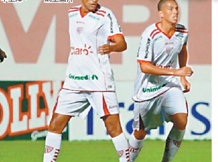
李華度兩仔爺一齊披甲上陣。

由於年齡問題，在足球場上，父子同時上陣幾 乎是前所未有。前歐洲足球先生李華度日前在自 己祖家巴西的聖保羅州聯賽中寫下父子兵同時在 場上披甲之傳奇。