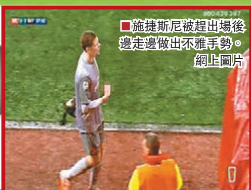
施捷斯尼被趕出場後邊走邊做出不雅手勢。