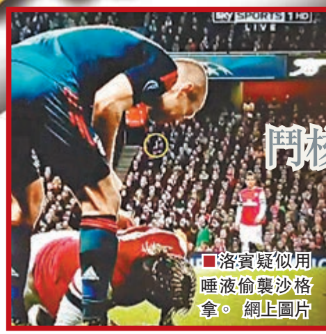
洛賓疑似用唾液偷襲沙格拿。