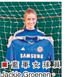
藍軍女球員 Jackie Groenen。

英格蘭車路士女足日前簽入一位 有比利時與荷蘭雙重國籍的19歲美 女新兵 Jackie Groenen。至於日前 寸巴塞羅那現實力屬近年最差的車仔 男足領隊摩連奴，就被巴塞球星法比 加斯大叫「收聲！」火藥味濃。