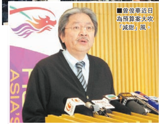
曾俊華近日為預算案大吹「減甜」風。

張炳良表示明白慈善機構可能有購置住宅物業的需要，但在當前市況下，我們必須審慎考慮不同界別對住宅物業需求的先後緩急。他指，參考過現行從價印花稅及額外印花稅機制後，政府會在條例草案中建議，向《稅務條例》第八十八條下獲豁免繳交稅項的慈善機構贈贈的住宅物業，可獲得豁免繳納買家印花稅。