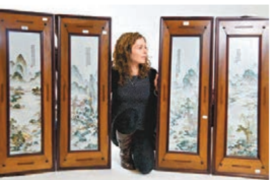
■4幅屏風原估價值僅300英鎊。

估價師布羅梅爾指出，一開始曾接觸幾個中國內地交易商，但他們沒太大興趣，之後一名交易商提出以1萬英鎊(約13萬港元)購買，令他認為屏風價值可能更高。他表示，高價成交意味屏風的年代較原先估計久遠得多。