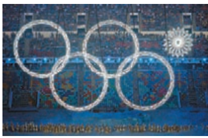
■開幕禮原定5片雪花匯聚一起，幻化成環形，但結果只綻放4片雪花。