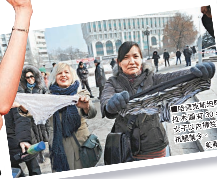
■哈薩克斯坦阿拉木圖有30名女子以內褲笠頭抗議禁令。

禁令早於前年生效，但無即時執行，胸圍、打底褲等產品不受限制，可繼續出售。歐亞經濟聯盟認為，喱士內褲物料吸濕力不符合規定，會危害女性健康。俄國紡織業聯盟指，當地內褲銷量每年逾40億歐元(約425.7億港元)，其中八成產品是外國