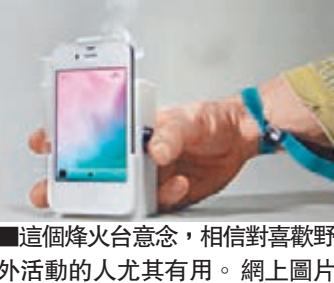
■這個烽火台意念，相信對喜歡野外活動的人尤其有用。

訊商收費，安全又經濟。只需將燈油注入裝在iPhone上的噴霧器，待其加熱蒸發，按一次擊便可釋出一股煙霧，用家可按噴煙次數指涉不同訊息，不過要事先與受訊一方協議不同次數代表的內容，才能確保通訊有效。