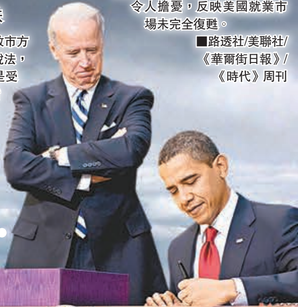
美國2009年深陷金融海嘯，奧巴馬上台僅一個月便簽署6.1萬億港元救市方案。資料圖片