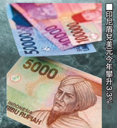
印尼盾兌美元今年攀升3.3%。