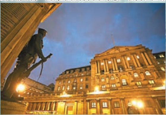
英倫銀行(左)和瑞士央行採取針對性干預應對樓泡，但被指效果遠不及加息。