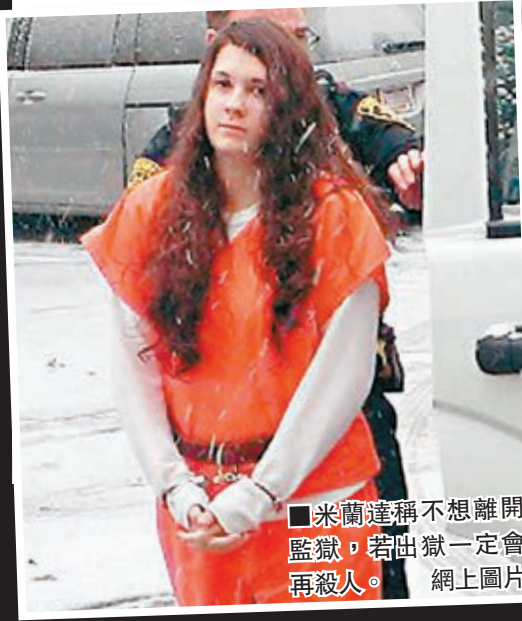
米蘭達稱不想離開監獄，若出獄一定會再殺人。