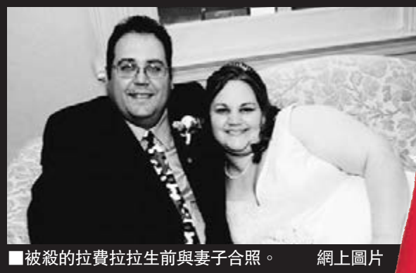
被殺的拉費拉拉生前與妻子合照。

11月與新婚丈夫合謀殺死一名男子，被扣留期間，她爆出更驚人內幕。年紀輕輕的她自稱是撒旦邪教信徒，過去6年間先後在故鄉阿拉斯加、得州及北卡羅來納州等地殺了最少22人，「殺到第22個人後停止計數」。聯邦調查局(FBI)大為緊張，已介入調查。