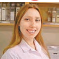
任大學講師時以白袍示人。