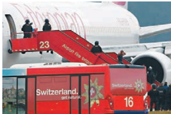
乘客在警方保護下撤離。

埃塞俄比亞航空昨日一架原定飛往意大利羅馬的客機，遭31歲副機師劫持，要急降瑞士日內瓦機場，無人受傷。被捕的副機師聲稱在埃國人身安全受威脅，希望尋求瑞士庇護。根據瑞士法律，劫機者最高可判囚20年。