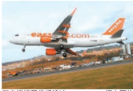
客機機翼幾乎撞地。

英國近日受狂風暴雨吹襲，歐洲廉航易捷航空一架空巴A320客機，上週六準備降落倫敦盧頓機場時遭遇強烈氣流，機身翻側，機翼幾乎撞到地面，幸好機師及時放棄降落抽起機頭，才避免釀成大禍。