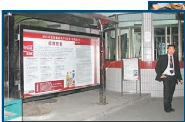
東莞可口可樂工廠招聘信息欄前應徵者寥寥。

中國社科院社會學所副所長張翼表示,雖然國家在大力倡導企業發展戰略轉型,但就產業結構升級來看,企業轉型升級的速度慢於預期,勞動力市場對較低文化程度勞動力的需求仍然非常旺盛。如果東西部地區產業結構不改變,東西部勞動力爭奪戰將會一直打下去。在過去的30年裡,東部沿海地區大批的製造類企業正是依靠「人口紅利」得以快速發展,張翼分析認為,這些企業在充分利用勞動力的同時,卻不給予相應的養老報酬、市民待遇,所以在農民工力力的爭奪上就沒有優勢。「如果這些企業不再轉換觀念,那麼東部地區很快就會喪失低端產業的競爭優勢。」