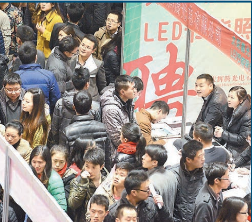
內地春節後招聘會遇冷,因工種錯配,不少企業找不到合適的工人,但亦有不少求職者找不到合適的工作。圖為重慶市春季人力資源招聘大會,有1,200餘家企業提供約3萬崗位。