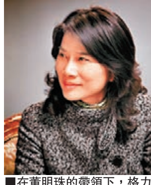
在董明珠的帶領下,格力電器年營業收入突破千億。

本報珠海傳真 選冠軍,IBM掌門人羅睿蘭榮獲亞軍,百事公司CEO盧英德當選季軍。格力電器(SZ000651)董事長兼總裁董明珠以及SOHO中國CEO張欣脫穎而出,分別排名第42位和第49位,代表中國商界女性登上了這份全球性的榜單。