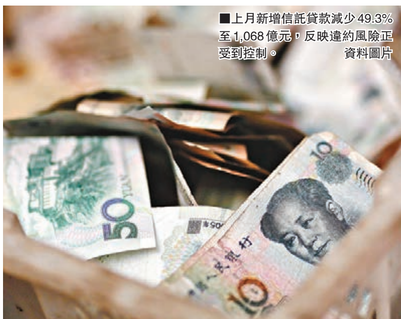
上月新增信託貸款減少49.3%至1,068億元，反映違約風險正受到控制。資料圖片

上海社科院經濟景氣研究中心主任劉規松認為，通脹壓力下降，經濟增長速度趨緩，加上貨幣政策有時滯效應，建議貨幣政策儘快逐漸小規模放鬆，以支持實體經濟穩定增長。