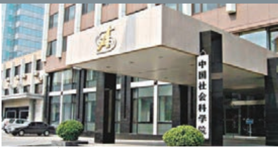
中國社會科學院位列非美國的全球頂級智庫第九名。