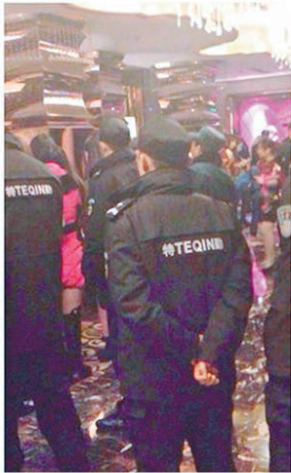
蘇州如皋市公安突擊檢查市內娛樂場所，抓獲100餘名涉黃人員。