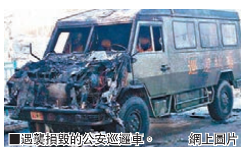
遇襲損毀的公安巡邏車。

經新疆警方查明，該案是一起有組織、有預謀的暴力恐怖襲警案件。三年前，麥合木提江·托合提開始宣揚宗教極端思想，一些人員受其影響，思想逐步走向極端。自2013年9月起，以麥合木提江·托合提為首的13人陸續聚集，收聽觀看暴恐音視頻，進行體能訓練，結成暴恐團夥。今年1月以來，該團夥購買作案車輛，製造爆燃裝置、砍刀，多次試爆，預謀伺機襲擊公安巡邏車輛。14日16時許，該團夥成員分乘作案車輛，攜帶爆燃裝置，手持砍刀，實施犯罪。警方現場繳獲數十枚爆燃裝置